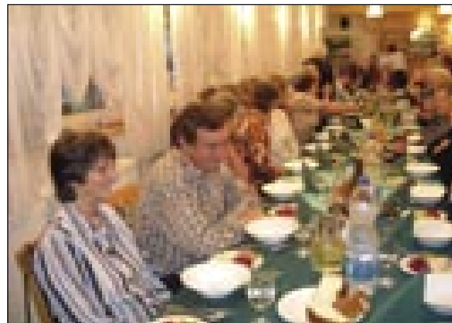
Občni zbor se je končo v restavraciji Lipa

guča se je predsednica, zvöjn sponzorom, lepau zavalila za vse pomauč, trüde vsejm členom predsedstva, steri prej dosta več delajo direktno z lidami kak ona sama: Drüštvi upokojencev Murska Sobota, Slovenski zvezi, restavraciji Lipa, števanovskim, veričkim, andovskim