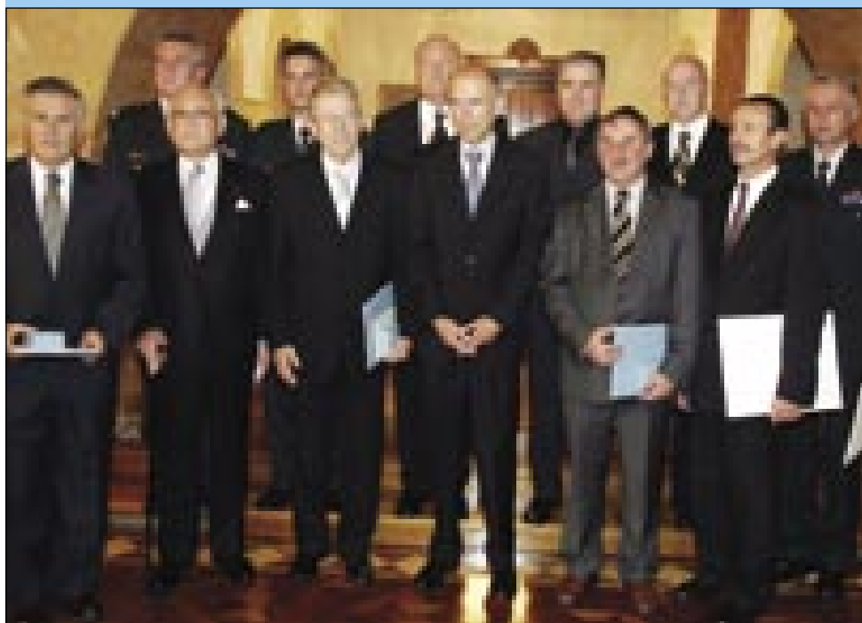
Skupinska slika odlikovancev

in številnimi novimi dejavnostmi se je razvilo in obo- gatilo kulturno življenje, ki pomembno prispeva k ohranjanju jezika in kulturnega izročila vseh Slovencev na Madžarskem.