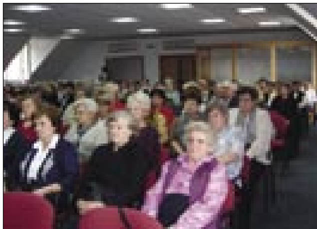
Porabski penzionisti so se lepau zbrali

je spozabilo od svoji žensk tü nej, stere spejvajo v Monoštri pa Števanovci s pomočtjauv Slovenske zveze. Na jubilejnom svetki so zvün kulturnoga programa ocenili 10-letno delo, so meli cerkveni