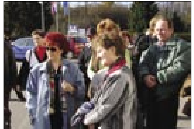
Popoldanski program je bil namenjen spoznavanju občine Moravskih Toplic

tacija je obnovev kulturnega doma, v okviru doma bodo uredili turistično-informacijski center, izoblikovali učno pot z imenom »Travniške orhideje« in zgradili dve počivališči, eno na začetku, drugo na koncu učne poti. Vzpostavili bodo informacijske table, kjer lahko turist prebere vse pomembne informacije tako o zgodovini vasi kot o flori in favni pokrajine. Izdali bodo turistični vodnik, ki bo promoviral tako Verico s Porabjem kot Občino Moravske Toplice.