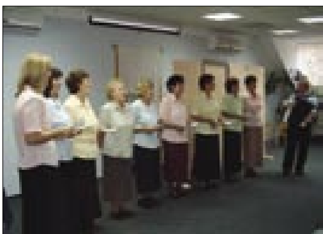
V programi je gorastaupo pevski zbor Slovenskoga društva iz Sombotela

gvušno furt z nami na programaj, depa mi se tü usakšo paut posaba spaumnimo od