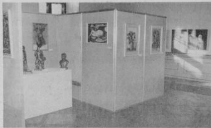
Motiv z razstave delavcev in učencev občine Slov. Bistrica

V prostorih gradu v Slov. Bistrici je odprta prva razstava umetniških, likovnih in drugih stvaritev delavcev, učencev in cicibanov iz skoraj vseh krajev občine Slov. Bistrica.