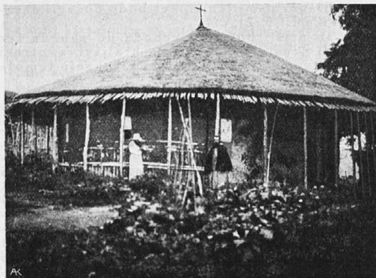
Revna cerkev v prefekturi Djibouti (Abesinija).