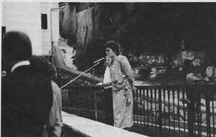
Na otvoritvi prenovljene čevljarške zbirke v muzeju.

V prenovljenih prostorih muzeja odprta čevljarška zbirka — Predstavitev razvoja Peka — sodelovanje pri prenovi