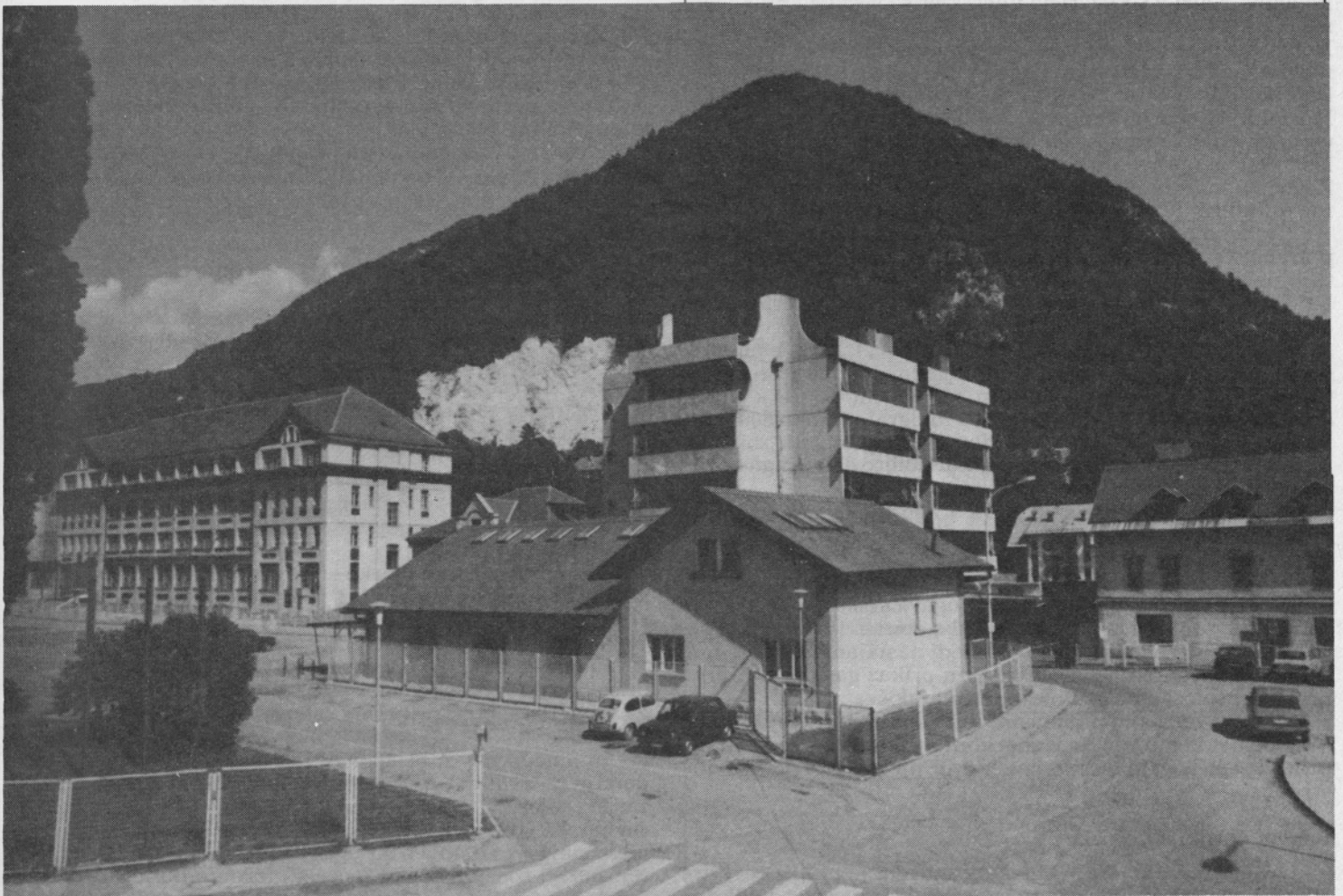
»PEKO« 85 letni jubilent