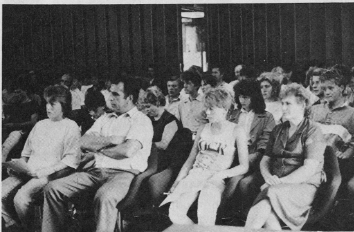
Starši in učenci na prvem srečanju s Pekom.

Naj predstavitev številko o letošnji beri našega štipendijskega razpisa zaključim s sklepom, da se moramo vsi truditi in iskati možnosti, da bi vsakdo, ki je začel, študij tudi dokončal in da bi čim več naših štipendistov v procesu izobraževanja doseglo vsaj eno stopnjo več kot so ob vpisu načrtovali.