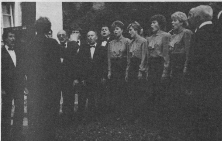
Nekaj pesmi so zapeli člani komornega zbora Peko.

Prenovljene zbirke čevljarstva, ki smo jih odprli 1. julija letos, so le začetek obsežnejših dopolnitev prikaza nekdanje in tudi sedanje »šuštarije«. Vse doslej opravljeno delo je ob enem zanimiv prikaz, kako moreta sodelovati delovna organizacija in kulturna institucija. Tudi za to in ne samo za to, gre vse priznanje kolektivnemu poslovodnemu odboru in strokovnim delavcem in ne navsezadnje tudi vsem Pekovim delavcem.