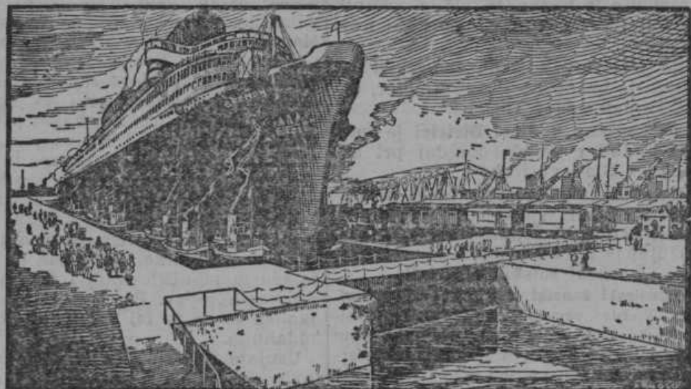
Orjaška prekooceanska nemška motorna ladja »Bremen«, ki je bila pred leti spuščena v morje in jo bodo letos v lukn mesta Bremen na sveže prepleskali.