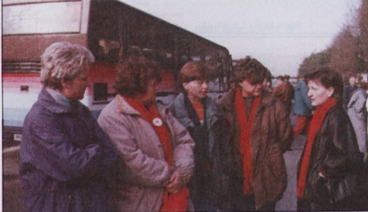
Delavke Delte Konfekcije s Ptuja so med potjo poklepetale v Tapanju.

parkiriščih, kjer so se ustavljali in pozdravljali udeleženci iz različnih krajev.