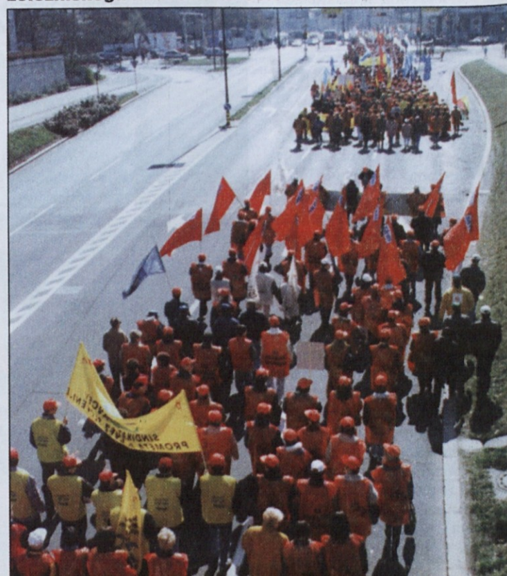
Pohod kolone protestnikov v mestno središče, posnet z železniškega nadvoza na Celovski cesti.