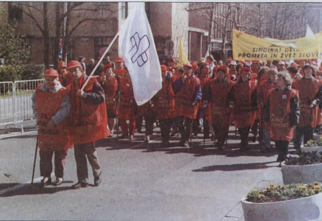
Delavke iz več domžalskih podjetij so skušale pokazati, da se bodo pri 65 letih opirale na palice, torej ne bodo mogle delati.