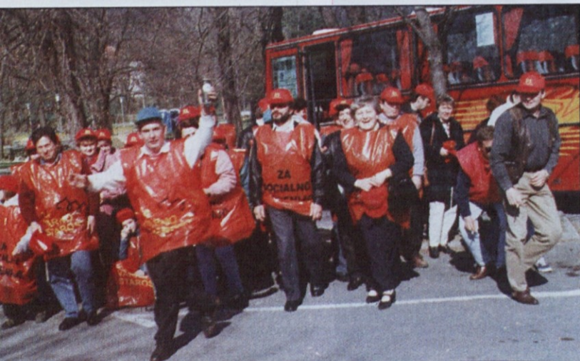
Takole so se delavci usuli z enega od avtobusov.