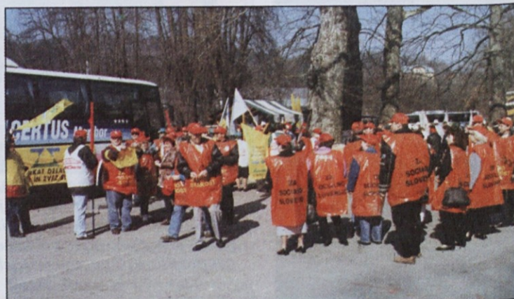
Organizatorji pravijo, da je v Tivoli pripeljalo prek 150 avtobusov, veliko je bilo Certusovih. Iz Sindikata prometa in zvez Slovenije so prišli tudi šoferji Ljubljanskega potniškega prometa. Na naši fotografiji se Posavci, ki so prišli med prvimi, pripravljajo za povorko.