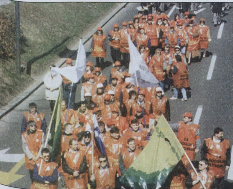
Podvozu na Celovški cesti se bližajo tekstilke, ob njih so korakali rudarji iz Velenja (SPESS). Zadaj pihalna godba iz Logatca.

Razumljivo je, da tisti, ki jim takšna vlada in pravni (ne)red omogoča zaslužiti vsak mesec eno zlato opeko, podpirajo delo do petinšestdesetega leta. Podpirajo reformo namerno uničenega sklada pokojninskega zavarovanja,