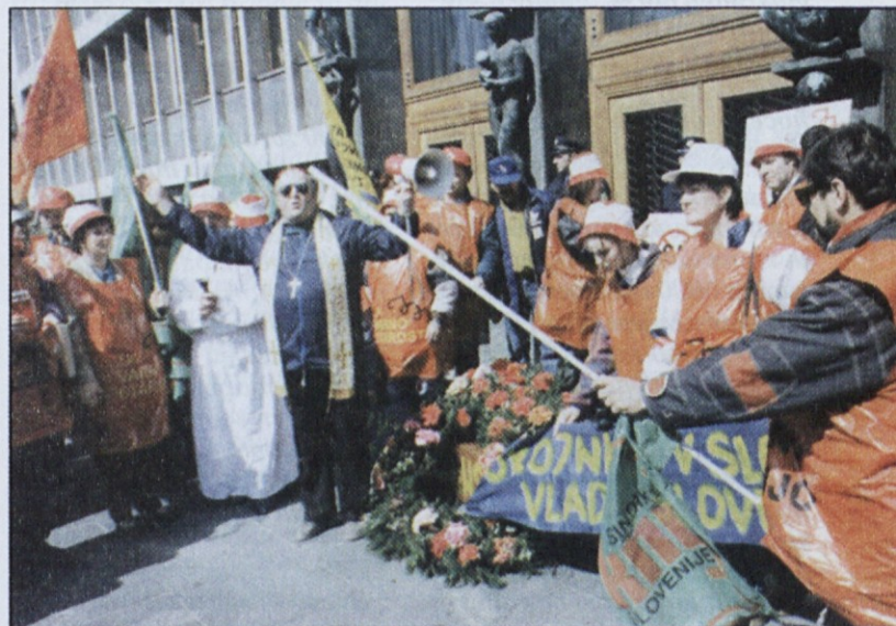
Pogrebno slovesnost za belo knjigo so pripravili sindikalisti Cinkarne Celje. Da bi pokojnico lahko pustili državnemu zboru, je množica spontano porušila varovalno ograjo. Presenečeni varnostniki in policisti so to sprejeli le z zaskrbljenimi obrazi.