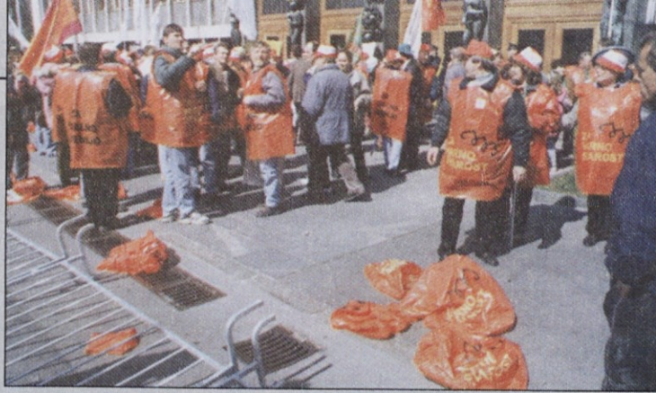
Takale je bila varnostna ograja po spontanem pohodu pred zgradbo državnega zbora. Protestniki so na njej pustili tudi precej telovnikov. Za varno starost, enega je plezalno razpoloženi Gorenjec obesil celo na visoko drevo ob Beethovnovi ulici.