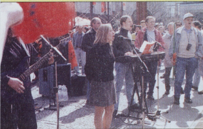
Ansambel Veseli kovinarji je za slovo protestnikom zainstaliral še nekaj novih priredb starih revolucionarnih pesmi. Ti so se jim pridružili, saj so jim pesmi ostale v lepem spominu.

In organizacija, ki je sestavila tako slikovito in mavrično kolono kot sama mavrica in tako dolgo, da je bila njena glava na Trgu republike, njen rep pa še vedno v Tivoliju, je na to res lahko ponosna. Ponosno, s polno mero zanosa in dvignjeno glavo so udeleženci protestnega shoda korakali po Ljubljani z dvignjenimi zastavami vseh barv, transparenti in napismi, s sprehajalnimi palicami, sodi in bobni, s krsto in vencem, z ragljami in piščalmi, z godbo na pihala – skoraj ni bilo roke, ki ne bi česa nosila, in ni bilo srca, ki ne bi bilo za ta protest. Avtobusi, ki so pripeljali udeležence iz vse Slovenije, so preprosto preplavili Tivoli.