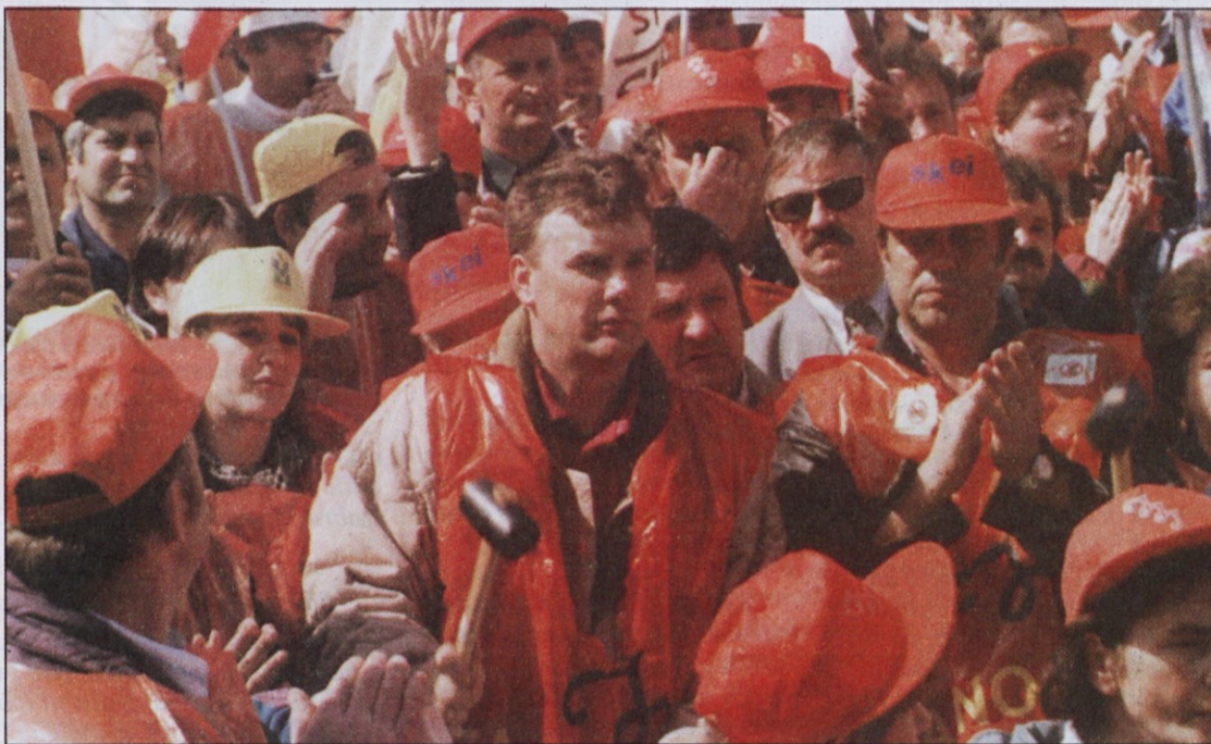
Kape dokazujejo, da je bilo v ospredju precej kovinarjev.

Vladi predlagamo, naj namesto tega posodobi in prenovi sedanji sistem.