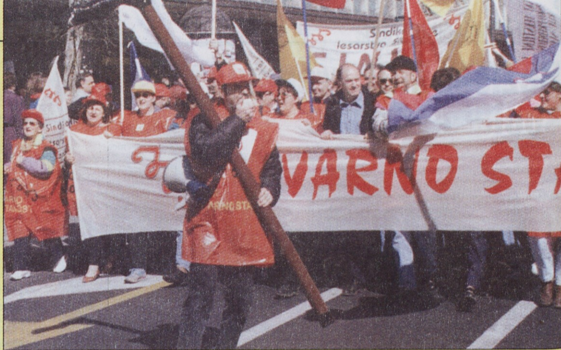
Čelo kolone protestnikov prihaja po Šubičevi na Trg republike. Veseli so, saj se zavedajo, da je za njimi močno zaledje.

Veličastno in še enkrat veličastno! Dvajset tisoč nas je sestavilo čudovit mozaik – mozaik, ki bo še nekaj časa v ospredju delavskega in sindikalnega gibanja.