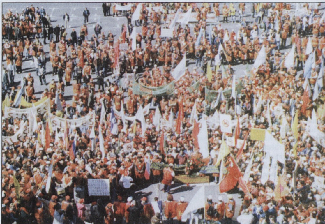
Množica na Trgu republike je vladi namenila veliko grdih besed, največkrat je bilo slišati Vlado na grmado. Dan prej so drugi sindikalisti klicali na pomoč celo Jugoslavijo, Tita in Partijo.

Tekstilci, usnjarji, državljani Republike Slovenije, vsi v skupen korak in upamo, da država ne bo to storila in dovolila, da bo njena delavka in delavec - državljan Republike Slovenije na starost le ubog prosjak in siromak.