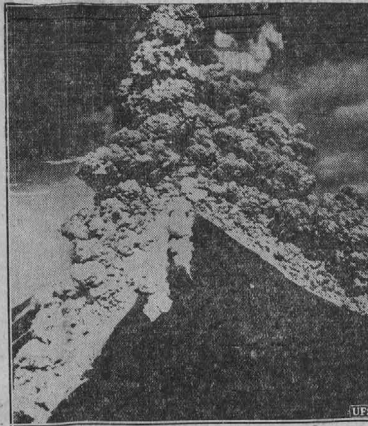
Ta ognjenik, 200 milj južno od Manile, na Filipinih, je bil smatran mrtvim, ko je zadnje dni naenkrat začel bruhati lavo.