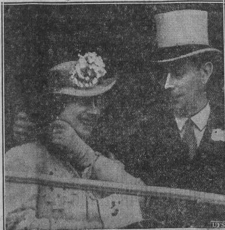
Angleška kraljevska dvojica, ki je napravila formalen obisk v Pariz, Francija.

Naravnajte radiu na MYSTERY CHEF vsak torek in četrtek 8:45 A. M.