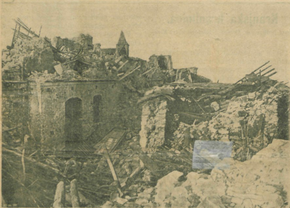
Potres v Južni Italiji.

Sedanji svet je podoben družbi, ki pleše nad ognjenikom. Ker mi smo že v dosegu ogromne, vse obsegajoče krize, strašnejše od vseh dosedanjih, pred katero pobleddijo tudi višji sloji. To bo mogoče razumel vsakdo, kdor pomisli, da vsled kupičenja zasebnih prihrankov v bančnem in borznem kapitalu nastaja tako mednarodno izprepletanje zasebnih prospahov in podjetij, da more povzročiti izbruh večje evropske vojne takšne nesreče, da bi bila brez primere v zgodovini. Posledice take nezališane krize bi bile tako grozne, da si jih ne moremo niti predstaviti. Te dočasne, bolj omejene krize so, oz. bi nam imele biti opomin, da bi se vzbudili iz lahkomišljenosti, v kakoršno je potopljena vsa