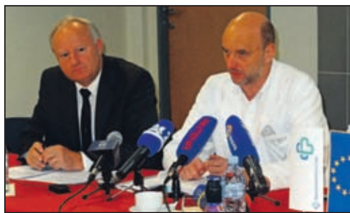
V celjski bolnišnici obveznosti do dobaviteljev ves čas poravnavajo v rokih.

Z doseženimi devetmesečnimi rezultati poslovanja so v bolnišnici zadovoljni, ker so kljub krizi, ki je mnoge slovenske bolnišnice pahni-