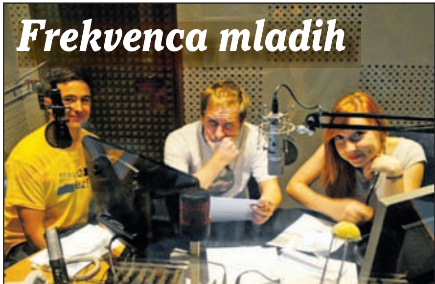
Med zadnjo oddajo

Frekvenca mladih je novo-stara oddaja na Radiu Velenje. Je oddaja, ki jo kreirajo mladi Velenjčani pod budnim očesom velikega brata Mladinskega sveta Velenje. Oddajo lahko