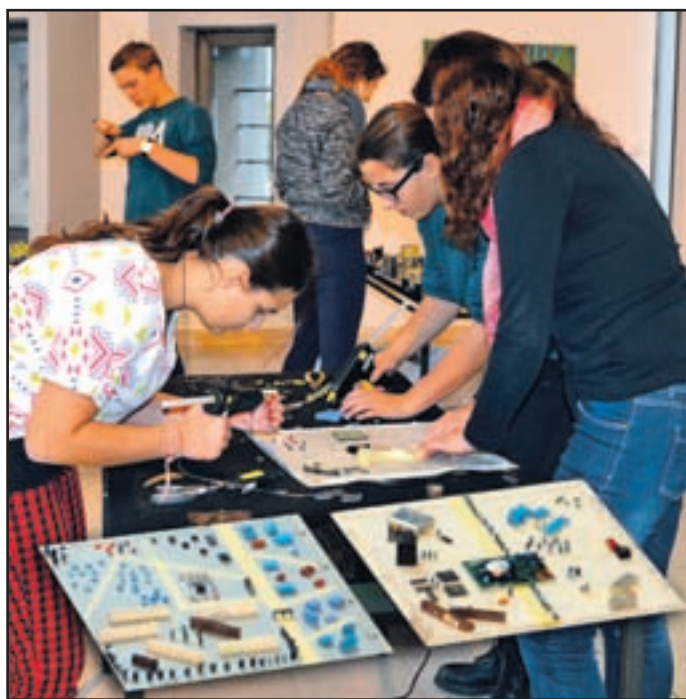
Dijaki velenjske umetniške gimnazije so uživali v ustvarjanju makete mesta iz različnih vezij strojev, ki jih izdelujejo v Gorenju.