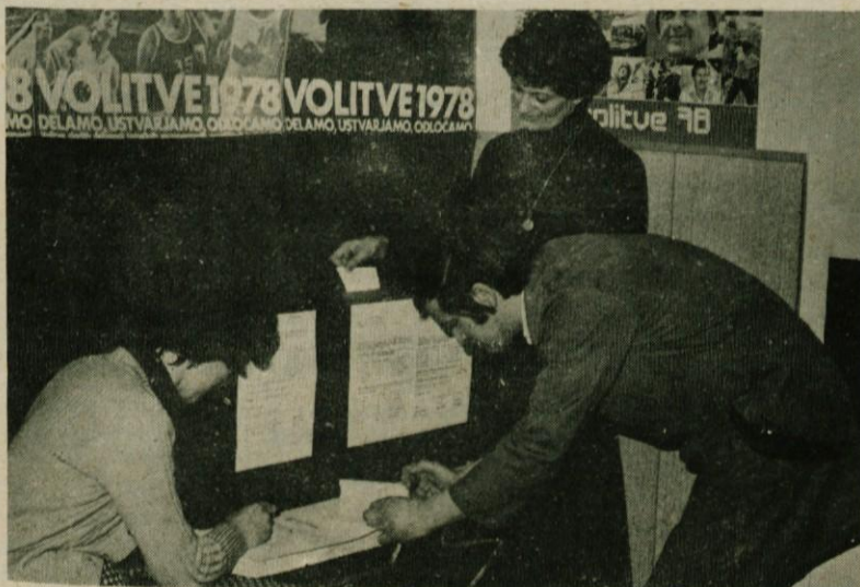
Delavci v delovnih organizacijah so že v jutranjih urah opravili svojo dolžnost in izvolili tiste, ki so jim zaupali delegatske funkcije