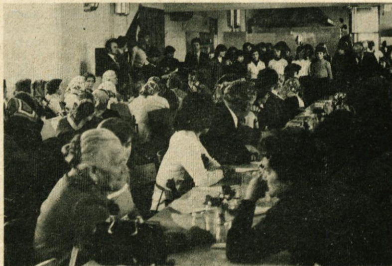
S srečanja žensk, ki je bilo za članice ZVVI ob 8. marcu organizirano v Domžalah