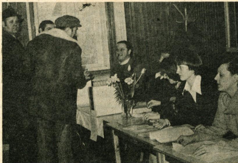
Tudi obrtniki in pri njih zaposleni delavci so 9. marca volili svoje delegate za zbor združenega dela in skupščine samoupravnih interesnih skupnosti

Na voliščih v KS je potekalo tudi glasovanje o delegatih za druž-