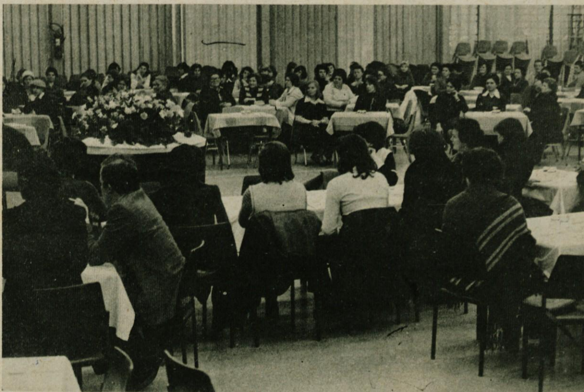
Na zboru delegatk v Domžalah, ki je bil namenjen seznanjanju o delu v skupščinah, položaju žensk in njihovem prazniku