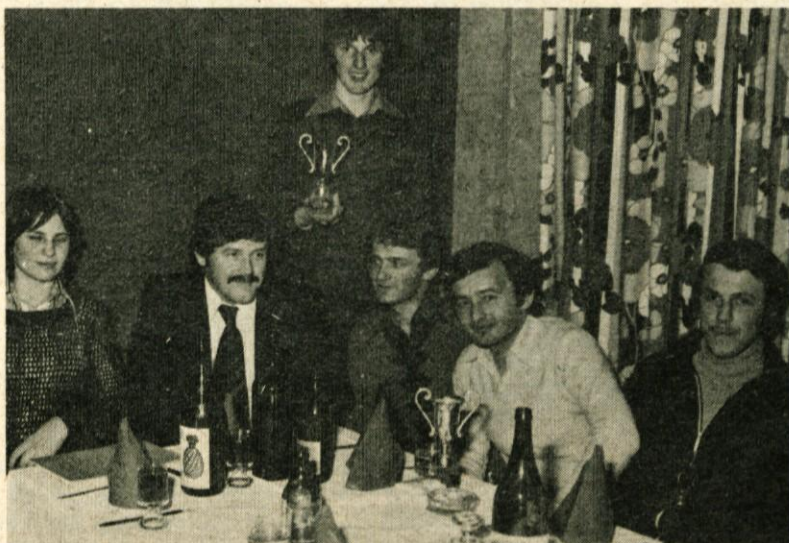
Nagrajenci, ki so prijeli priznanja za svoje uspešno športno delo