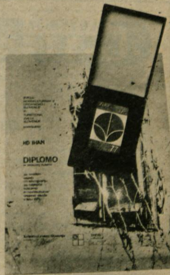
Bronasta diploma, ki jo je prejelo Hortikulturno društvo v Ihanu

Pa se povrnimo še v KS Ihan, kjer smo že v naslovu zapisali, da v „Ihanu tudi ne spimo“. In resnično ne spimo, kajti glede organiziranosti na tem področju smo že pred samimi Domžalami. Že takoj po uspešni uveljavitvi delegatskega sistema, smo v KS izvolili tričlanski odbor za varstvo okolja in narave. Začele so se delovne akcije mladine, gasilcev, nogometašev in ostalih. Organizator je bil prav ta odbor. Ko so delegati v KS videli, da se dela resno, smo bili deležni tudi finančne pomoči. Na pomoč smo poklicali tudi Arboretum. Z njihovo strokovno pomočjo in materialom smo uredili veliko neurejenih površin, katere so bile last SLP. Uredili smo tudi okolico novega vrtca, katerega lahko prištevamo k enemu najlepše urejenih vrtcev v Sloveniji. Organizirali smo odvoz smeti, odstranili „divja“ smetišča, postavili opozorilne table in še bi lahko naštevali. Vsa ta dela dobivajo vso večjo razsežnost, vse več se gradi. Delali bomo novo pokopališče, zgradili bomo nov center Ihana, zato smo se v odboru odločili, da ustanovimo Hortikulturno društvo. Preteklo leto marca, po ustanovni skupščini in zanimivem predavanju smo ga tudi dobili.