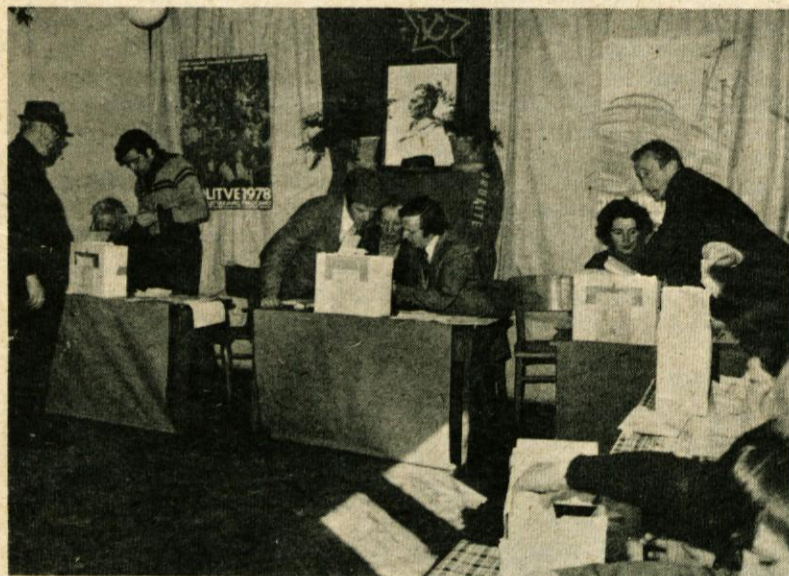
Na volišču v Češnjicah so že sredi dopoldneva zaključili volitve, zato so člani volilnih odborov lahko začeli s preštevanjem glasov

se povsod sestali volilni odbori in opravili vsa predpisana opravila ter s pomočjo mladincev okrasili volišča ter zunanost naselij.