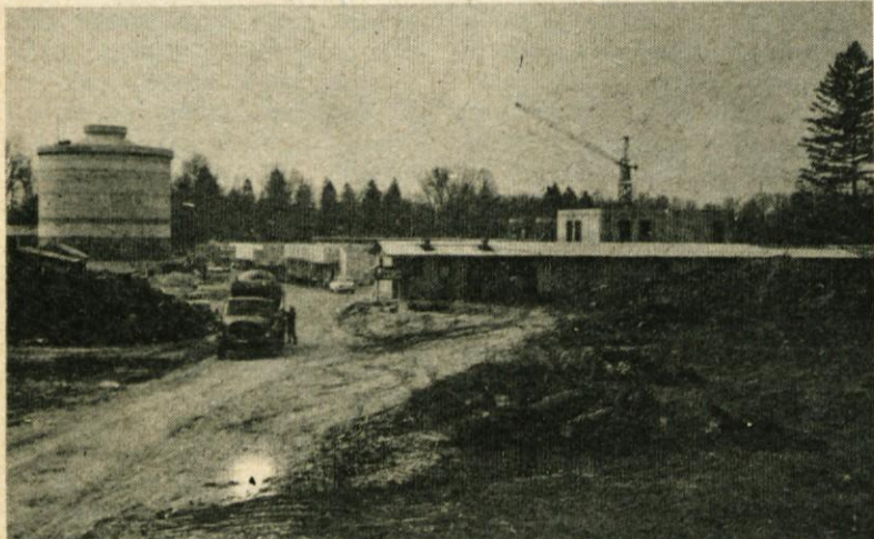
Na gradbišču centralne čistilne naprave v Študi potekajo dela po načrtih in graditelji pravijo, da bo do konca julija vse na red za otvoritev

Glede na to, da bo koncem meseca julija začela obratovati čistilna naprava, je potekala razprava