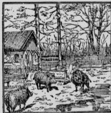
Kje je paznik zverinjaka?