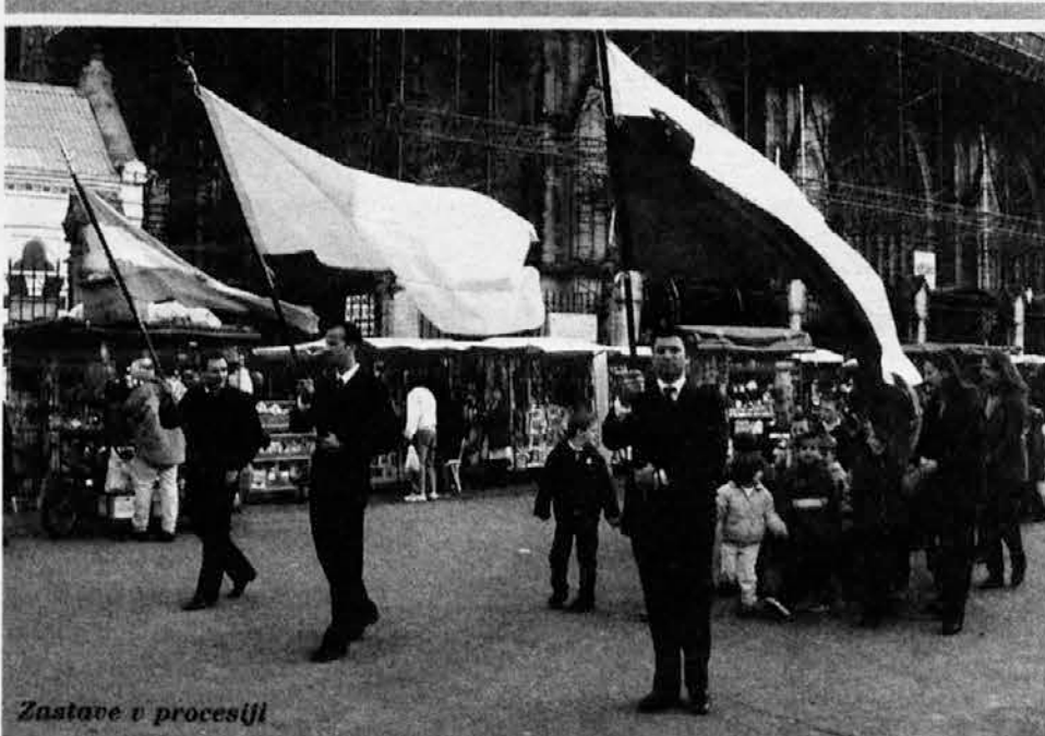
Zastave v procesiji

S tem pa se bo olajšal ekonomski položaj slovenske kulture. Slovenska kultura (posebej še slovenska knjiga) je temeljna vsebina slovenske identitete, zato mora država zagotoviti čim večjo dostopnost Slovencev do kulturnih dobrin. Torej ravno nasprotno od Argentine.