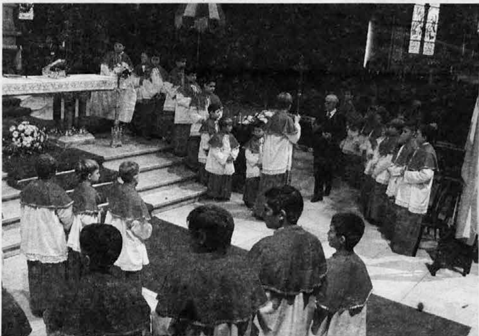
Ministranti pred oltarjem