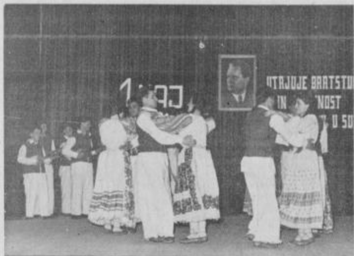
Folklorna skupina RKUD Sloboda Varaždin pleše na I. tednu Bratstva in prijateljstva 1962. leta v Ptuj.

bolnišničnem dvorišču koncert zboru Emila Adamiča.