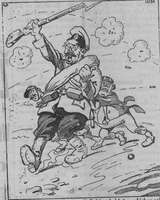
Jwan: Ich will ja gar nicht, aber die Beiden da hinten schieben so!