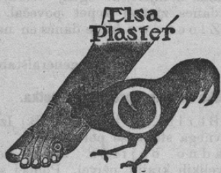
Kdor svojih kurjih oces ne odstrani, mu je vsaka pot muka ter slabi z bolečino tudi celo telo. 502

Zapadno bojišče. Armada prestolonaslednika Rupprechta. Na raznih točkah menjajoče močni ognjeni boj. Vzhodno od Yperna so se angleški poizvedovalni sunki izjalovili, naši oddelki pa so pri St. Quentinu napravili nekaj vjetih. — Armada nemškega prestolonaslednika. Po čez dan močnemu artiljerijskemu ognju stajali so Francozi zvečer z znatnimi silami k napadu vzhodno od Cerny. Naval se je izjalovil v našem ognju in v boju z ročnimi granatami pod velikimi izgubami. Z istim neuspehom končalo je ponoči več sunkov proti našim jarkom južno posesti La Belleville in Ailles. Našim četam se je posrečil napad na neko sovražno stražo pri Mennejeanu. V zapadni Champagni bil je večeraj zjutraj še en napad Francozov na gori Cornillet zavrnjen. Na levem bregu Maase povišal se je zvečer ogenj do velike ljutosti. Zvečer se je izvršil močan francoski napad na višini 304 in zapadni strani „Toter Mann“. Sovražnik je bil odbit za nekatere kose jarkov se še borimo. — Ponoči od 6. na 7. so se razven bombnega metanja blizo fronte tudi zračni napadi na nemškem ozemlju vršili. Sovražni letalci metali so v westfalskem ozemlju, v Trieru in okolici, nadalje na Mannheim in Rodalben skupno nad 100 požarnih bomb. Vojaške škode ni nastalo. Eno sovražnih letal je padlo v našo roke. V jutru dne 7. julija napadlo je potem