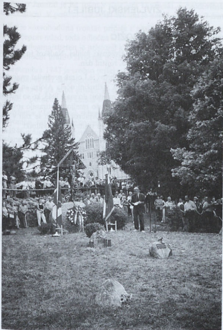
Iz proslave v Midlandu - Kanada