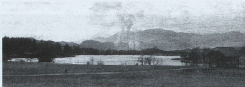
Škalsko jezero pri Šoštanju je vas preselilo na trdna tla.