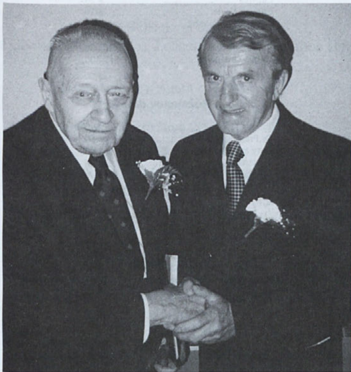
Z majorjem ob njegovi 90-letnici.