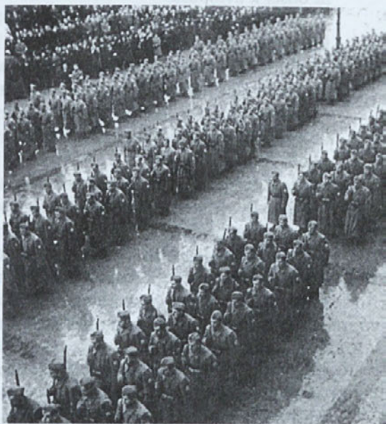
Domobranske čete se zbirajo 18. decembra 1943 za pogreb padlih v Kočevju.

V povojnem obračunu so se komunisti najbolj krvavo znesli nad slovenskimi domobranci. Ti so bili odločni disciplinirani vojaki, ki so komuniste potisnili daleč v Kočevski Rog, vse do hrvaške meje. Posebno njihovi udarni bataljoni so čistili slovensko zemljo po dolgem in počez, da je v večini partizanom, zašel strah v kosti.