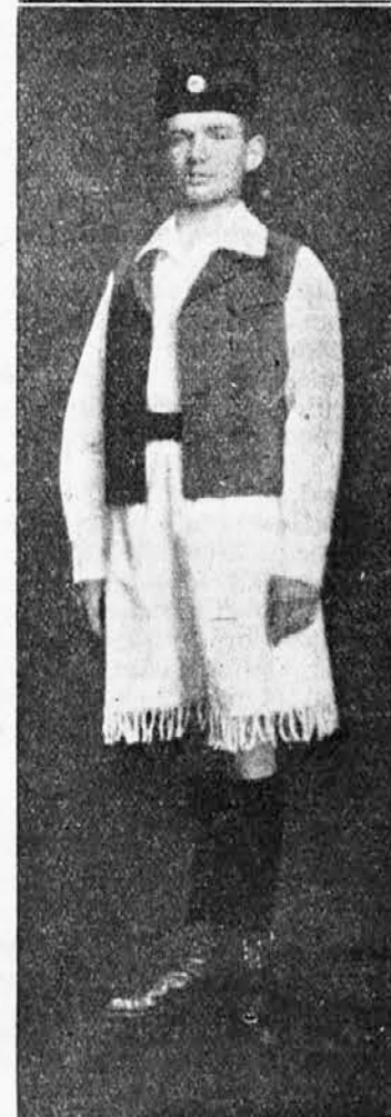
Svečana odora muškog naraštaja.

Donosimo sliku jednog naraštajca obučenog u najnoviju svečanu odoru muškog naraštaja, koju je izradio br. B. Palčić iz Zagreba, kako je prihvaćena na ovogodišnjoj glavnoj skupštini JSS u Kragujevcu. Odora se odlikuje svojom jednostavnošću i otmenošću, pa smo uvereni, da će je naš naraštaj zavoleti u punoj meri tako, da ćemo na ovogodišnjim sletovima našu uzdanicu pozdraviti u tim novim svečanim odorama.