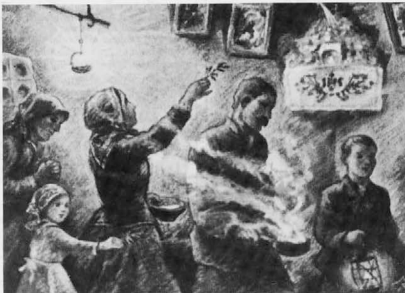
Tako so nekoč blagoslavljali dom na božični večer

Na Sveti večer (24.12) je veljala zlasti na Goriškem, tržaškem Krasu, ob furlanski meji in Istri