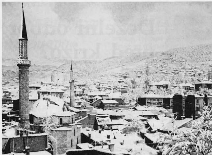
Sarajevo pozimi... in še v miru

Potem ko so razkosali Bosno in Hercegovino, ko so se polastili ob nekdanji tih, zdaj pa že povsem očitni pomoči bosanskih Hrvatov, večjega dela ozemlja, Karadžić in njegovi zahtevajo še razdelitev Sarajeva.