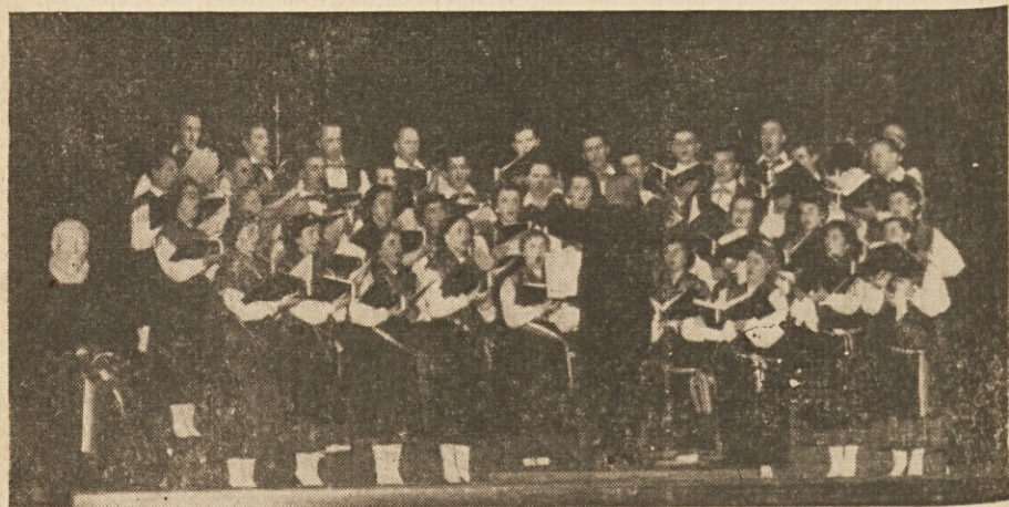
Slovenski pevski zbor „Gallus“ ob priliki slavnostnega koncerta, ki ga je priredil ob svojem desetletnem jubileju požrtvovalnega dela za slovensko občinstvo v Buenos Airesu