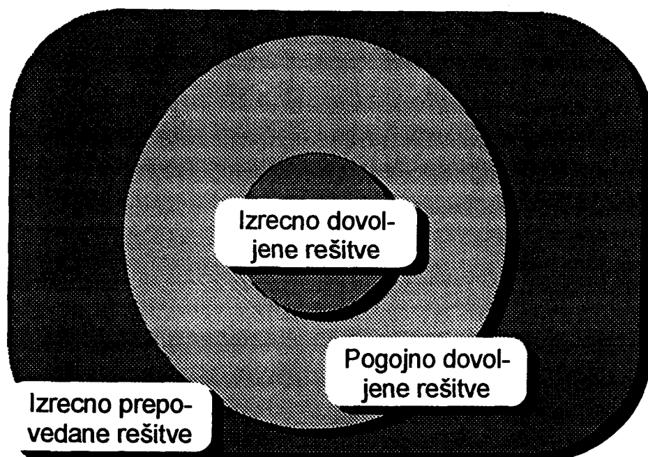
Slika 1: Polja odločitev glede na dovoljeno in nedovoljeno

Med vprašanja o načinih, torej o postopkih pri proizvodnji izdelkov oz. opravljanju uslug, štejejo tudi skladnost teh načinov z državnimi, mednarodnimi normami kot tudi - če problem razumemo širše - z zapisanimi in nezapisanimi pravili poslovnega oz. strokovnega obnašanja, s tradicijo in bontonom. Med rešitvami, ki so izrecno dovoljene in tistimi, ki so izrecno prepovedane, obstaja široko polje - siva cona, v kateri presojamo rešitve tudi po njihovi etičnosti (slika 1). Pogosto nam pri tem manjkajo merila in sodila - zapisana ali nezapisana, kot so tradicionalne navade in običaji. Zapisana pravila, ki ne nosijo obveznosti zakonov oz. predpisov, lahko najdemo v različnih kodeksih poklicne etike, ki utrjujejo stroko in ji dajejo avtonomijo in samozavest (STRITIH 1996, KOŠIR/ANKO 1996).