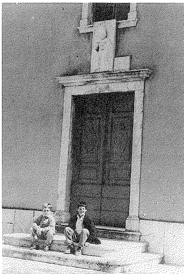
Sv. Peter pri Piranu (Foto: D. Darovec, 1990)