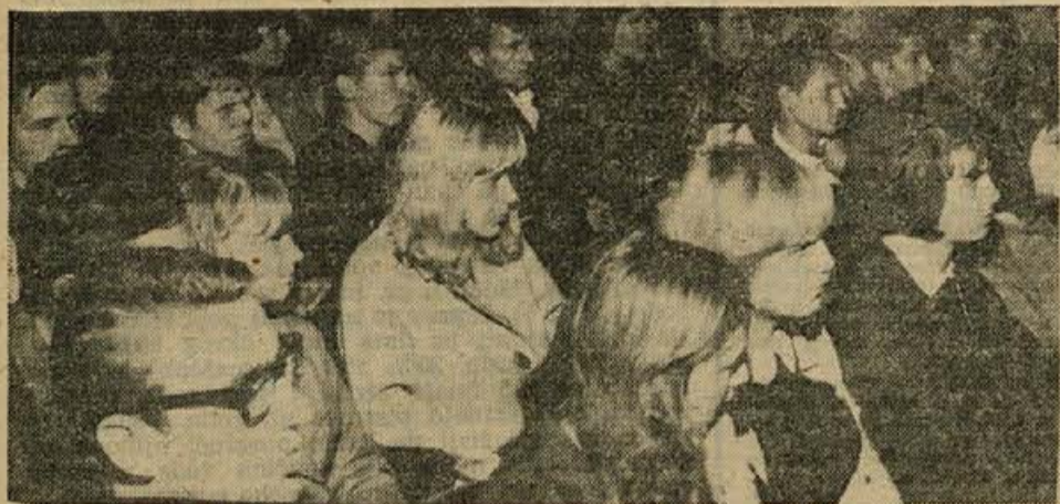
Mladinci in mladinke na sobotni konferenci

Na koncu so določili smernice za delo v letošnjem šolskem letu in izvolili nova odbora enotnega mladinskega aktiva in šolske skupnosti. Še pred tem so govorili o gospodarski reformi v šoli; menili so, da dijaki lahko najbolj pomagajo z boljšim učenjem, večjo aktivnostjo v izvenšolskem udejstvovanju in manjšim izostanjem od pouka