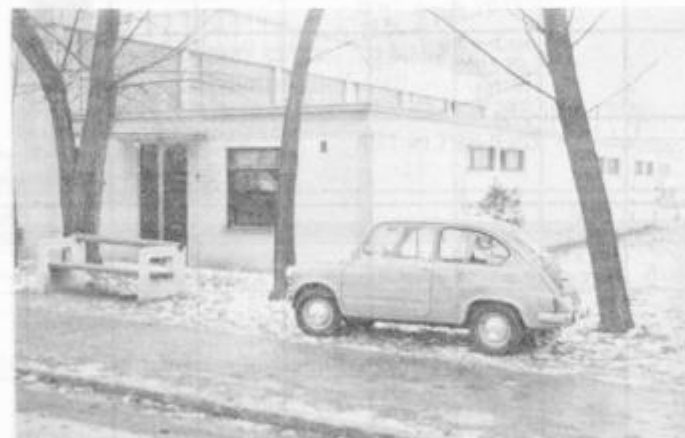
Strelišče pri športni dvorani Mladika, ki čaka na obnovo strehe

strepo nad streliščem hale Mladika. Nadalje je razprava tekla glede financiranja strelcev, ki se udeležujejo tekmovalni višjega ranga. Podan je predlog točkovanja strelcev za najboljšega športnika v občini, kajti vsako leto je pri tem prišlo do največjih problemov, ki jih pa bodo z novim točkovanjem Med drugim so se v razpravo vključili tudi strelci discipline TRAP-SKEET, torej naši lovci. Podali so svoje probleme glede strelščev v Slovenji vasi in zlobnih jezikov, ki jim mečejo polena pod noge, tako da to olimpijsko strelišče sameva. Kajti z organiziranimi tekmovalci na tem strelišču bi se pridobila sredstva, ki so šla za gradnjo. Pri tem bi se vsaj nekako s tekmovalci ta sredstva vračala in se lahko naložila v druge prepotrebne namene strelskega športa. Na občnem zboru so razrešili dosedanje člane odborov in predlagali nove člane, ki so jih soglasno sprejeli. Na prvi redni seji v sredo, 22. februarja so strelci izvolili nove vodstvene predstavnike, ki bodo nadaljevali delo v OSZ in jo vodili