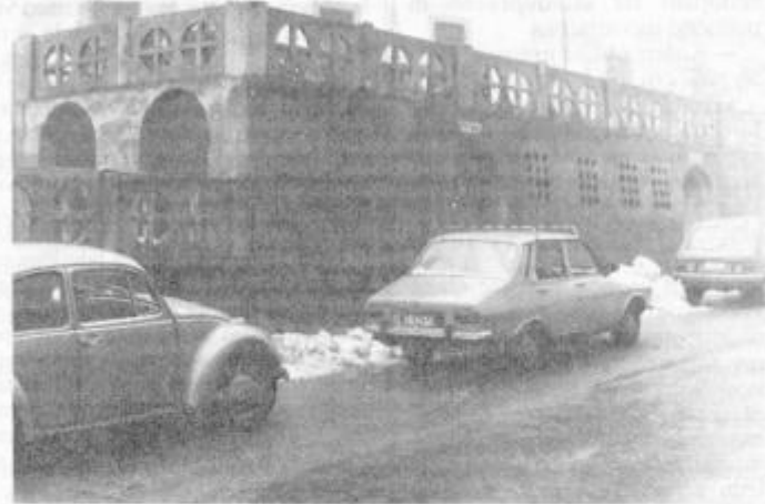
Nakdanja javna stranišča v Bežakovi ulici

pojavi na Minoritskem trgu, sedanjem Trgu svobode. Mestni očetje so si oddahnil čes, sedaj pa težav več ne bo. Joj, kako so se zmotili! Saj ne, da bi Ptujčani ne bili zadovoljni z napravami javnih stranišč — nasprotno! Čudovita je bila in lepo vzdrževana, čista. Toda, vojaki in otroci so „izživali oskrbnico tega lokala, marljivo in vestno, a duševno omejeno žensko“. Pa je bilo konec miru, saj so se pritožbe vrstile druga za drugo. Ti presneti frkolini, da nima človek nikoli miru — ja, težko in odgovorno je delo mestnih očetov.