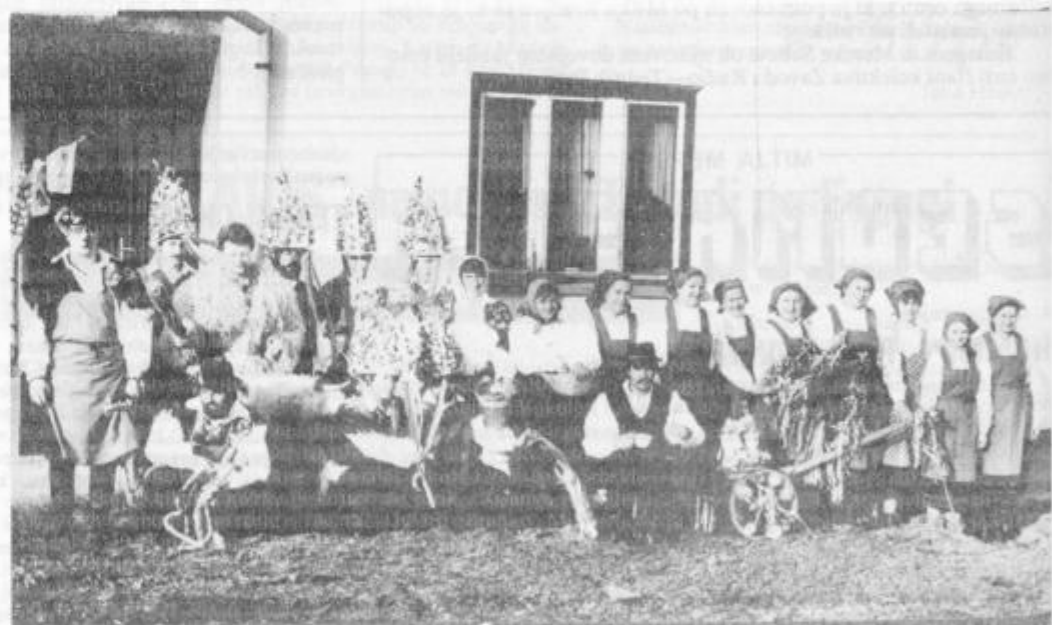
Člani novoustanovljenega folklornega društva Lancova vas. Manjka le skupina plesalcev, ki je v času fotografiranja bila na vaji.

Menimo tudi, da bi morali letos nameniti več denarja ali pa tistega, ki bo na voljo bolj racionalno izkoristiti, da bi boljše uresničili delegatski sistem. Predvsem bi morali poglobiti delo delegacij za skupščine samoupravnih interesnih skupnosti, želimo pa, da v krajevni skupnosti ne bi bilo občana, ki ne bi vedel, kako in kje se trošijo sredstva, ki jih prispevamo za te dejavnosti. N. Dobljekar