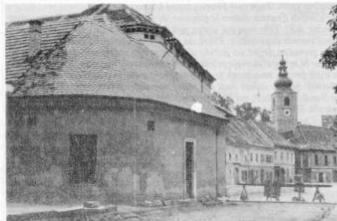
Polkrožni stolp na jugu nekdanjega Minoritskega trga pred zrušenjem. Fototeka kulturnozgodovinskega oddelka PMP št. F 519

Obzidje v vzhodnem delu mesta, ki je objemalo naselbino nekako na črti: peterokotna bastija pri novih vratih — bastija za minoriti — Dravski ali Vodni stolp, je bilo zgrajeno verjetno že v prvi polovici 13. stol. Predstavljalo je šibkejši del mestnih utrd. V zahodnem delu mesta so bili naravni pogoji obrambe ugodnejši, saj je ta starejši del naselbine dvignjen na vzpetini, novejši vzhodni pa je nastal na ravninskem, delno tudi zamočvirjenem terenu. Zato je bilo potrebno obzidje dodatno utrditi. Ob vzhodnem kraku so v izkopani jarek speljali Grajeno, v 15. stol. pa je nastala še zunanja ograda, ki je na vzhodnem