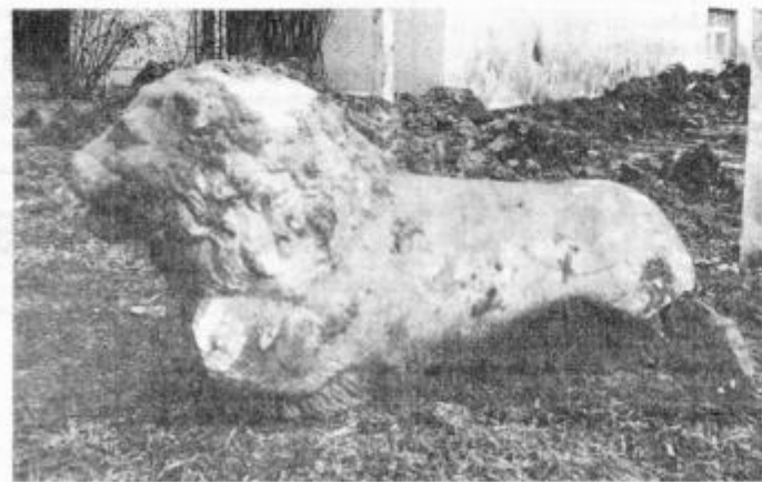
Skelet marmornatega leva je doslej pritegnil že več obiskovalcev, ki so ga pobožali po njegovi grivi.

ali ni morda na tem območju v zemlji še več ostalin iz rimskih časov. JOS