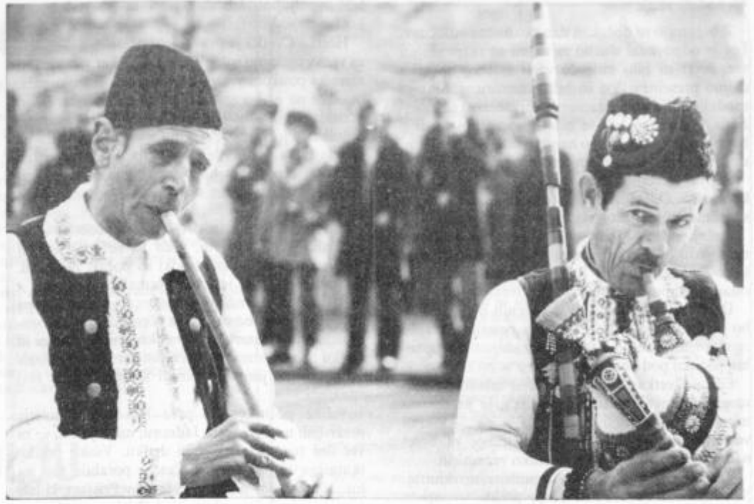
Člana folklorne skupine VASILČARSKI BABARI iz Bitole v SR Makedoniji. Skupina bo tudi letos sodelovala na Kurentovanju v Ptuj.

Kjerkoli sem, kamorkoli grem ob meni si ti.