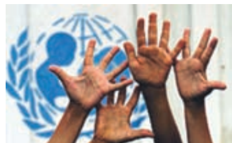
Otroci po svetu živijo v zelo različnih razmerah.

Koalicija držav pod vodstvom Savdske Arabije je v Jemnu razglasila 48-urno premirje, da bi podprla prizadevanja Združenih naro-