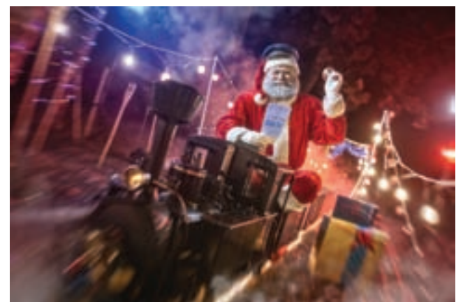
Doživetja s pravljicnimi vlaki in junaki – darilo za vso družino!

Božiček bo decembra potoval s skoraj 100 let starim muzejskim vlakom, na poti