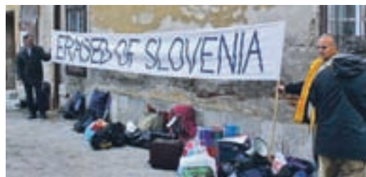
Evropsko sodišče za človekove pravice je tožbo izbranih zavrnilo kot neutemeljeno.

Državni zbor je s 64 glasovi za in nobenim proti potrdil vpis pravice do pitne vode