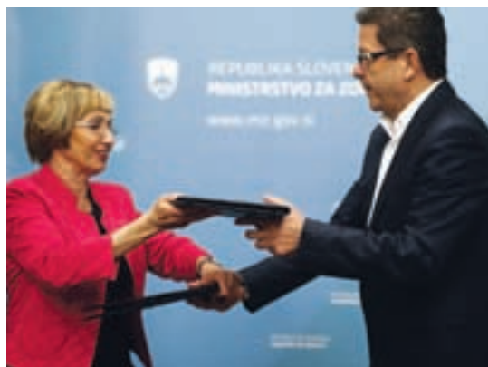
Zdravniki so stavko zamrznili.

Ministrstvo za zdravje in Fides sta parafirala sporazum o začasnih prekinitvi stavkovnih dejavnosti.