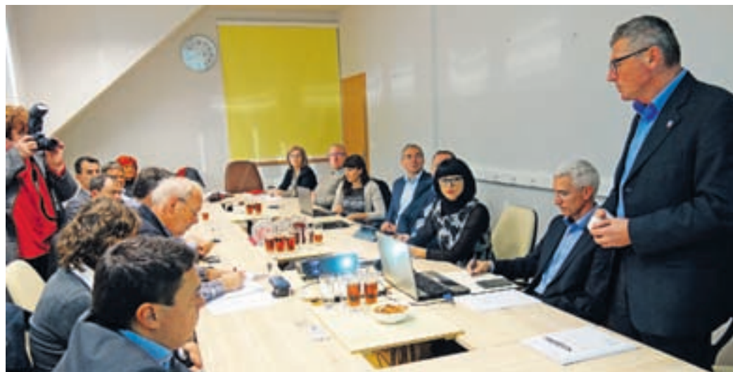
Člani upravnega odbora Savinjsko-šaleške gospodarske zbornice so se prvič sešli na seji v Občini Šmartno ob Paki.