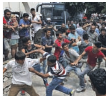
V pretepu prebežnikov v Beogradu je bil eden od njih ubit.

Iz medijev smo izvedeli tudi, da je Hrvaška