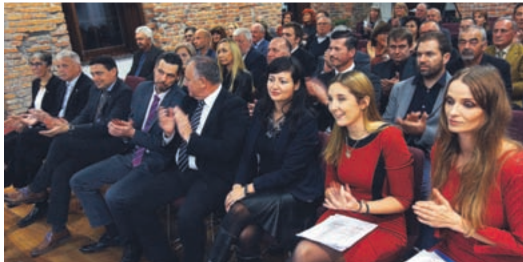
Na prireditvi so se s priznanjem zahvalili tistim, ki pomagajo soustvarjati pozitivno podporno okolje za malo gospodarstvo, ter obrtnikom podjetnikom ob okroglih obletnicah delovanja njihovih obratovalnic.

Območna obrtno-podjetniška zbornica Velenje podelila plaketo občinam Velenje, Šoštanj in Šmartno ob Paki za sodelovanje ter blizu 60 priznanj obrtni-