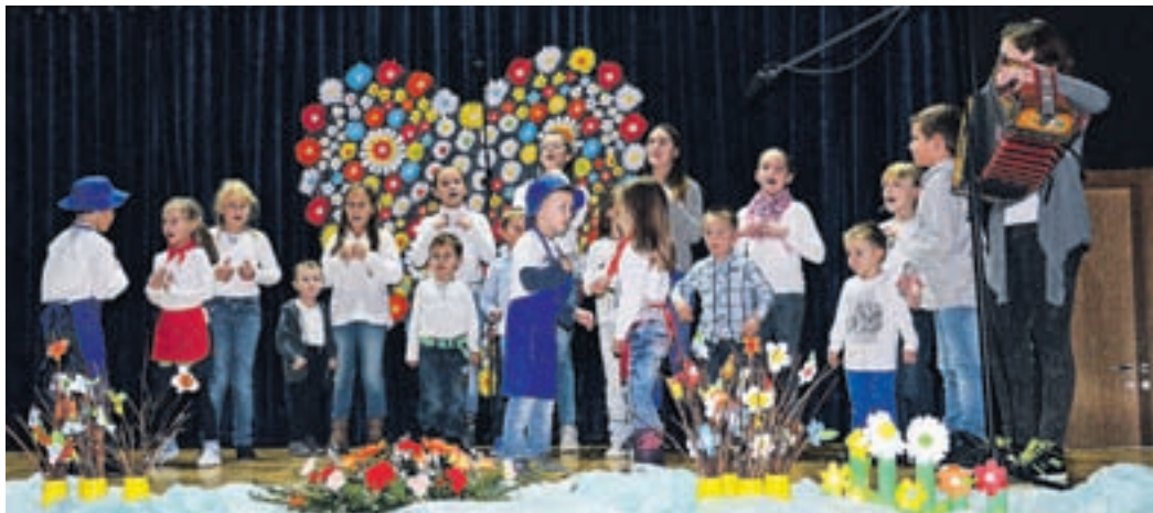
Gostitelji, DPM Ravne pri Šoštanju, so pripravili razgibano plesno-glasbeno točko. Sledili so jim otroci in mladostniki iz še 8 društev iz vse doline.