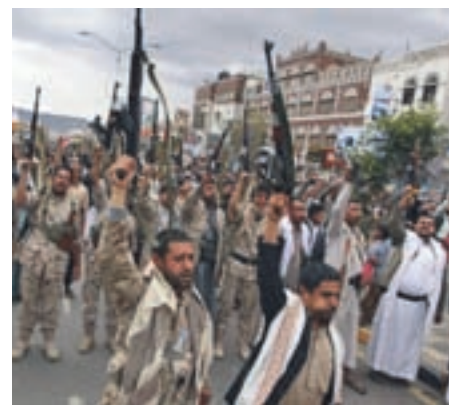
Premirje v Jemnu ni vzdržalo.

Novoizvoljeni ameriški predsednik Donald Trump je v šestih točkah razkril načrt za prvih sto dni vladanja in poudaril, da bodo z novo trgovinsko, migracijsko in obrambno politiko »ZDA znova postale močne«.