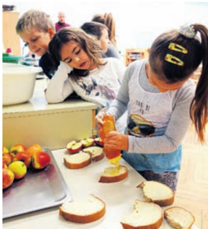
Prvošolci OŠ Mihe Pintarja Toleda so si oblikovali prste po slovenskem zajtrku – kruhu z maslom in medom, jabolku in mleku. Kaj sicer najraje jedo za zajtrk? Kosmiče, sadje in kruh z različnimi namazi. Zajtrkujejo vsak dan, pravijo.

Letos je Čebelarjeva zveza Slovenije projekt nadgradila s pobudo, da se ustvari najštevilnejši pevski zbor, ki je usklajen kot čebelarjeva družina zapel priljubljeno pesem Čebelar Ansambla Loj-