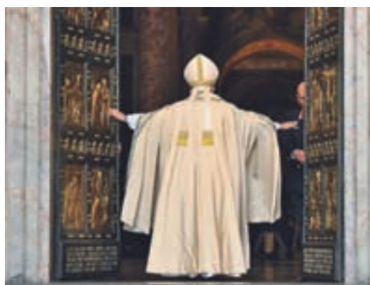
Papež je z zaprtjem vrat sklenil leto Božjega usmiljenja.

Papež Frančišek je z zaprtjem svetih vrat v baziliki svetega Petra sklenil leto Božjega usmiljenja, v katerem je pozornost svetovne javnosti usmeril k ljudem, ki so odrinjeni na rob družbe