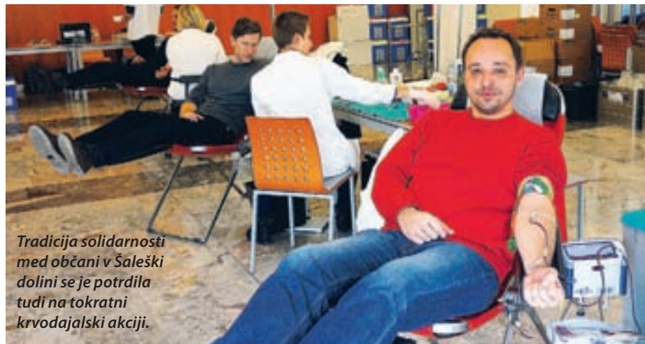
Tradicija solidarnosti med občani v Šaleški dolini se je potrdila tudi na tokratni krvodajalski akciji.

kot 4000 krvodajalcev na leto in tudi letos bodo preseglji to številko. »Ob tem moram povedati, da izgubimo na leto približno 500 krvodajalcev, ki darujejo kri na naših akcijah, stalno prebivališče pa imajo v občinah zunaj Šaleške doline.« Po analizi, ki so jo opravili pred nedavnim, je v občinah Velenje, Šoštanj