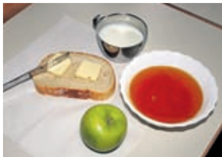
Na mizah je bil slovenski zajtrk.

Nemška kanclerka Angela Merkel je skupaj s koalicijskima partnerjema uradno naznanila zdajšnjega zunanjega ministra Frank-