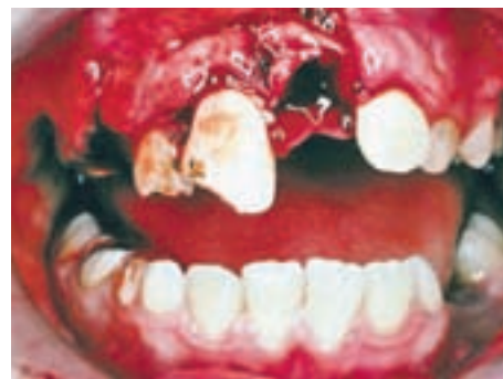
Dva zlomljena sekalca zgornji čeljusti in en izbit sekalec s poškodbo obzobnih tkiv. Zobje so zaradi poškodbe spremenili lego.

Izbitje stalnega zoba je nujno stanje! Zob, ki je celoti izbit iz ust (ima celo krono in korenino), primemo za kronski del in ga nežno speremo s hladno vodo. Izogibamo se dotikanju korenine, saj je to izrednega pomena za preživetje zoba. Če je to mogoče, zob reimplantiramo, kar pomeni, da ga vstavimo v alveolo (jamico, iz katere je izpadel),