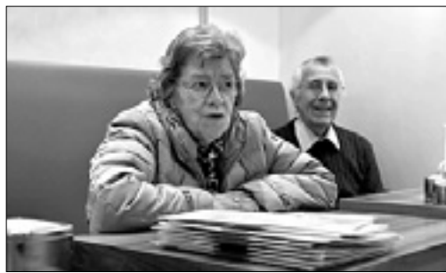
Predstavnika združenja Salaam