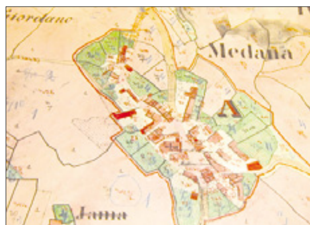
Izsek iz katastrske mape iz leta 1878