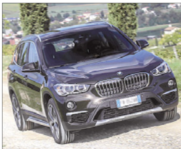
Najmanjši SUV bavarske hiše

Bavarci so predstavili novo generacijo svojega najmanjšega SUV X1, ki vsebuje kar nekaj novosti. Predvsem je prvi iz družine BMW šprtnih terenecv imel prednji pogon, saj sloni na novi platformi, ki že označuje minije in serijo 2 active in gra tourer. A to še ni vse, bi rekli reklamari, tu je tudi revolucija v motorjih, saj ima novi X1 prečno postavljeni novi 1,5-litrski trivaljni bencinski agregat in dvolitrski štirivaljni prisilno polnjeni agregat.