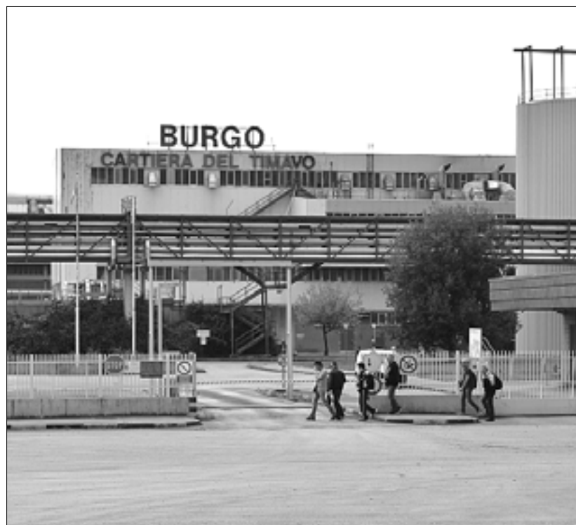
Delavci papirnice se bodo danes vrnili na delo