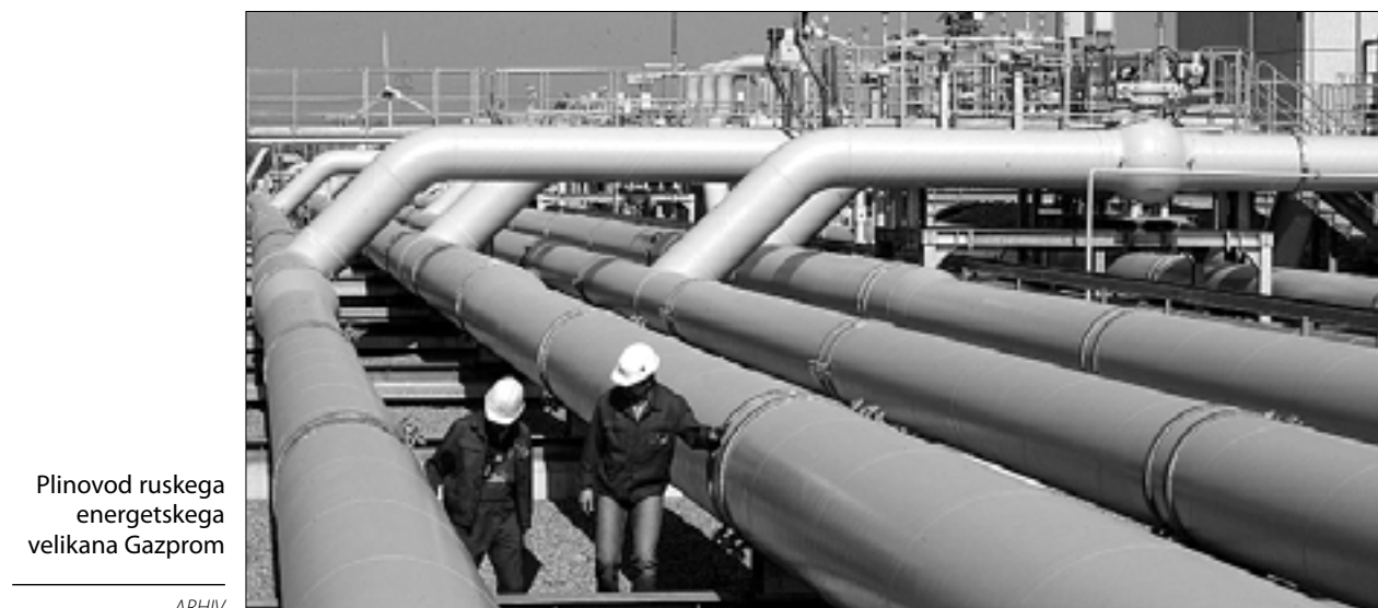
Plinovod ruskega energetskega velikana Gazprom

Prekinitev do novega plačila - Ukrajina ima trenutno plina dovolj, v težavah pa je s premogom