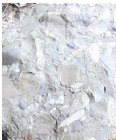
Konglomerat rečnega proda, iz katerega so izdelovali mlinске kamne (levo); Medana leta 2012 (desno)

Ne gre samo za ozko kategorijo ledinskih imen. Obravnavana so tudi krajevna imena, vodna imena, vzpetine. V primerjavi z dediščino, ki je ohranjena v arhivskem gradivu, se je predvsem z ustreznimi izročili v današnji čas preneslo približno dve tretjini imen. Treba je seveda upoštevati, da se tudi ledinska imena, tako kakor živ jezik,