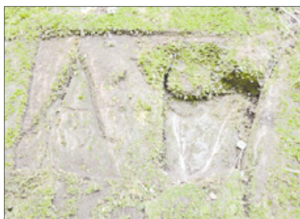
V živo skalo vklesan mejnik med Avstrijo in Benetkami