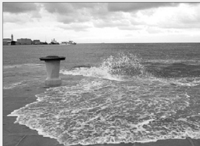
Morje je zalilo tržaški pomol Audace; pojav bo v bodoče vse pogostejši

ŽENEVA - Koncentracije ogljikovega dioksida in drugih toplogrednih plinov v ozračju so lani dosegle rekordne vrednosti, so opozorili v Svetovni meteorološki organizaciji (WMO). »Z veliko hitrostjo drvimo v nepoznano območje,« je ob objavi letnega poročila ocenil prvi mož organizacije Michel Jarraud. Dodal je, da vsako leto zno-