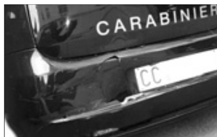
Poškodovano vozilo karabinjerjev