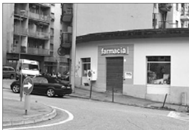
Roparja so v torek prijeli pred lekarno na Pončani

Med hišno preiskavo so v njegovem stanovanju zasegli 13 gramov heroina in precizno tehtnico. Russignanov jopič naj bi bil enak tistemu, ki ga je v trafikah imel na sebi eden od dveh roparjev. »Zelo je verjetno, da je aretirani izvedel tudi prva dva ropa,« je povedal Soldatic, ki je tudi potrdil, da se preiskava nadaljuje, saj morajo zbrati dokaze zoper njegovega sosterilca. (af)