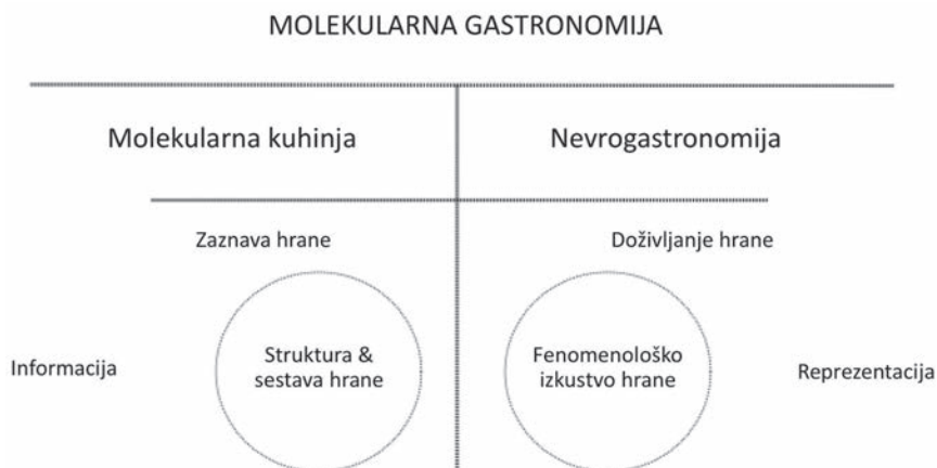
Slika 1: Ključni pojmi in razmerja med njimi

Oglejmo si zdaj nekoliko podrobneje različne faze v procesu doživljanja hrane. Najbrž ni pretiranega dvoma o tem, da svet okrog nas zaznavamo s pomočjo petih čutov (Sternberg, 2011: 88). Čutila opravljajo nekakšno detektivsko vlogo: »Iz množice podatkov objektivne realnosti izberejo le nekatere, ki so dovolj dober približek tistega, kar se v okolju dejansko dogaja. Zaznava ni niti natančen posnetek objektivne realnosti niti poljuben vtis o njej, ampak približek realnosti, ki se je v evoluciji vrste izkazal kot dovolj dober za preživetje.« (Tomc, 2011: 45) Vpogled v notranje procese doživljanja hrane omogočajo predvsem sodobni nevroznanstveni pristopi k raziskovanju nove možganske skorje (metode elektroencefalografa) in limbičnega sistema (metoda funkcionalne magnetne resonance), ki zaznavajo genetske in evolucijsko pogojene odzive na dražljaje iz okolja. V primeru priprave in uživanja hrane sta seveda ključni