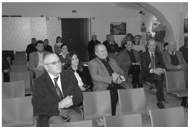
Referenti in gostje simpozija.