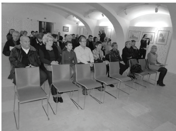
Obiskovalci razstave.

v domači, haloški pokrajini, saj je prav ta zanj neusahljiv vir ustvarjalnega zanosa. Stalne spremljevalke Lugaričevega slikarstva so tudi risbe, iz katerih je najbolj razvidno njegovo občudovanje vzornikov iz ljubljanske akademije, med imeni evropskega slikarstva pa najbolj občuduje Picassa.