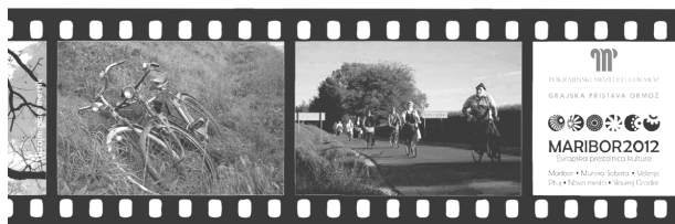
Filmsko potovanje Künštñih Prlekov med Muro in Dravo