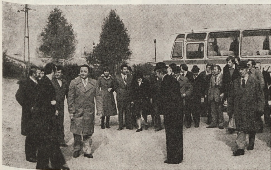
Koroški Slovenci z našimi predstavniki pred Interierom na Dupljici