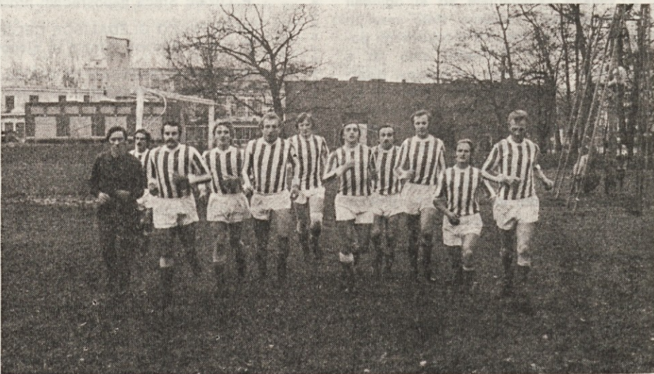
Stolovi člani pred tekmo v Jaršah