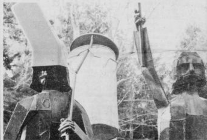
Pa naj še kdo reče, da posode za smeti niso vsestransko uporabne! Tako se je posodobil puntar pred ptujskim vrtcem na Raičevi 12 v noči s soboto na nedeljo. Škoda, da je pust že minil. McZ.