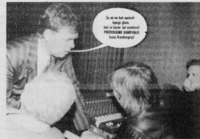
Pogovor, ki ga je posnela Orfejevko skrita kamera.

V Beltincih pri Murski Soboti je po anketi Murskega vala najbolj popularen Prekmurec Geza Farkaš pripravil koncert Zaigramo in zapojmo po domače. Dvorana je bila pre-