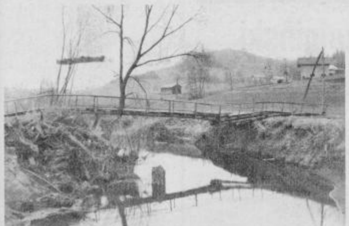
Dravinja — veliko romantike za vse, ki pridejo v te kraje samo na obisk, mnogo truda pa za tiste, ki morajo od te zemlje živeti.