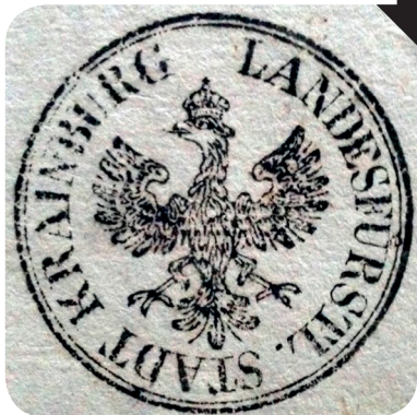
11. Štampelj iz 30. let 19. stoletja (Pirčeva barvarna). A stamp from the 1830s (Pirčeva barvarna).