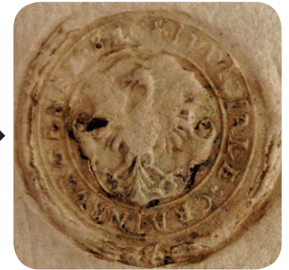
5. Mali sodni pečat iz prve polovice 16. stoletja (NŠAL 101, 1660 XI 12). A small judicial seal from the first half of the sixteenth century (NŠAL 101, 1660 XI 12).