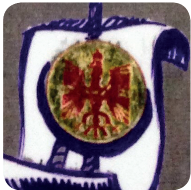
25. Znak Iska iz 30. let 20. stoletja (Stalna razstava Prelepa Gorenjska).

A stamp from the beginning of the twentieth century (Kos, Stavbna dediščina mesta Kranja v arhivskem gradivu).