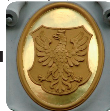
21. Grb na nekdanjem deželnem dvorcu iz 1902 (Hribovšek, http://www.grboslovje.si/novice/article_2008_10_27_1133.php ).

The coat of arms on the Pirc Award from 1913 (Pirčeva barvarna).