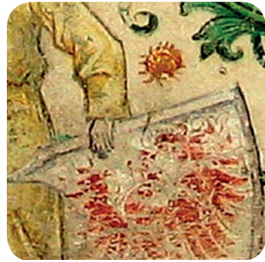
2. Prvi grb v antifonariju iz 1491 (NŠAL 102, a. e. 18, š. 9). The first coat of arms in the antiphonary from 1491 (NŠAL 102, a. e. 18, š. 9).