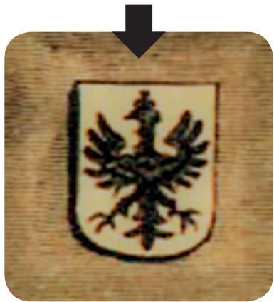
16. Beneschov grb v Bilder aus Krain iz 1891 (Sima, Bilder aus Krain).

Benesch's coat of arms in Bilder aus Krain from 1891 (Sima, Bilder aus Krain).