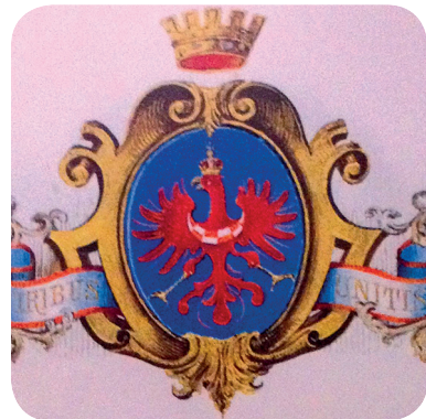
12. Grb na Bleiweisovi diplomi iz 1878 (Stalna razstava Prelepa Gorenjska). The coat of arms on Bleiweis' diploma from 1878 (the permanent exhibition Beautiful Gorenjska).