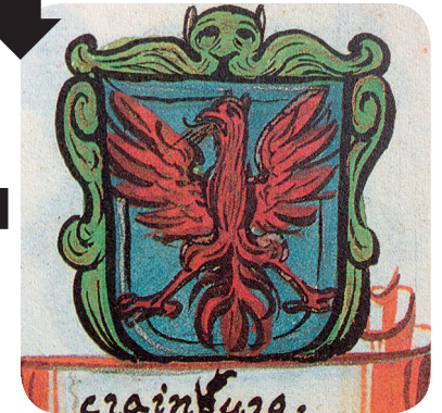
6. Grb v Veliki grbovni knjigi iz 1687/88 (Valvasor; Opus insignium armorumque). The coat of arms in Valvasor's armorial from 1687/88 (Valvasor; Opus insignium armorumque).