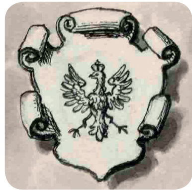
17. Beneschov grb na veduti okoli 1895 (NMS, inv. št. R-330).

Benesch's coat of arms in Bilder aus Krain from 1891 (Sima, Bilder aus Krain).