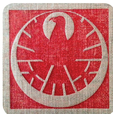
28. Neznani grb iz 70. let 20. stoletja (Kranjski zbornik 1970).

A stamp with a shield during the German occupation (ZAL KRA 2, a. e. 5084).