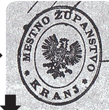
20. Štampelj z začetka 20. stoletja (Kos, Stavbna dediščina mesta Kranja v arhivskem gradivu).

Ströhl's coat of arms from 1905 (Ströhl, Städte-Wappen von Österreich-Ungarn).