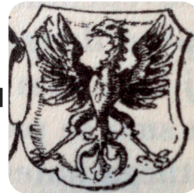
7. Grb v Slavi vojvodine Kranjske iz 1689 (Valvasor; Čast in slava vojvodine Kranjske). The coat of arms in The Glory of the Duchy of Carniola from 1689 (Valvasor; Čast in slava vojvodine Kranjske).