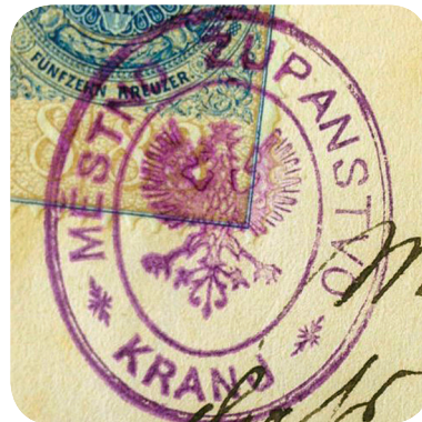
13. Štampelj iz 80. let 19. stoletja (ZAL KRA 2, a. e. 4177). A stamp from the 1880s (ZAL KRA 2, a. e. 4177).