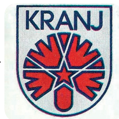
29. Socialistični grb iz 1979 (Slovenija, te poznam?).

An unknown coat of arms from the 1970s (Kranjski zbornik 1970).