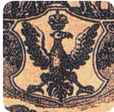
9. Grb v rokodelskem listu iz 80. let 18. stoletja (NMS, inv. št. G-2522). The coat of arms in an artisan diploma from the 1780s (NMS, inv. št. G-2522).