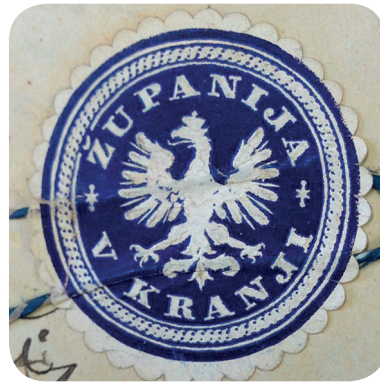
18. Pečatna nalepka s konca 19. stoletja (ZAL KRA 2, a. e. 4145).

Benesch's coat of arms in a veduta around 1895 (NMS, inventory number R-330).