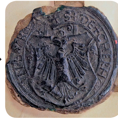
4. Pečat iz prve polovice 16. stoletja (NŠAL 101, 1530 IX 14). A seal from the first half of the sixteenth century (NŠAL 101, 1530 IX 14).