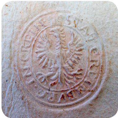
10. Pečat s konca 18. stoletja (ZAL KRA 2, a. e. 15). A seal from the end of the eighteenth century (ZAL KRA 2, a. e. 15).