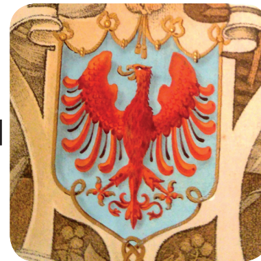
22. Grb na Pirčevem priznanju iz 1913 (Pirčeva barvarna).

The coat of arms on the Pirc diploma from 1921 (Pirčeva barvarna).