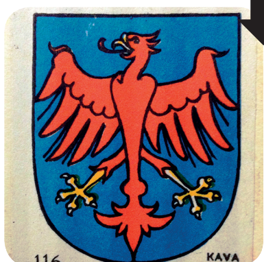
26. Grb v albumu Kava Hag iz 1933 (Laszowski, Grbovi Jugoslavije).

The coat of arms on the former provincial manor (Hribovšek, http://www.grboslovje.si/novice/article_2008_10_27_1133.php ).