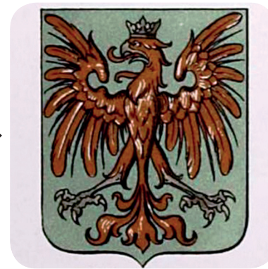
19. Ströhlov grb iz 1905 (Ströhl, Städte-Wappen von Österreich-Ungarn).

A seal sticker from the end of the nineteenth century (ZAL KRA 2, a. e. 4145).