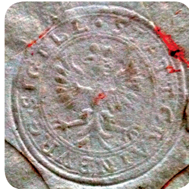
8. Pečat iz druge polovice 18. stoletja (ZAL KRA 2, a. e. 18). A seal from the second half of the eighteenth century (ZAL KRA 2, a. e. 18).