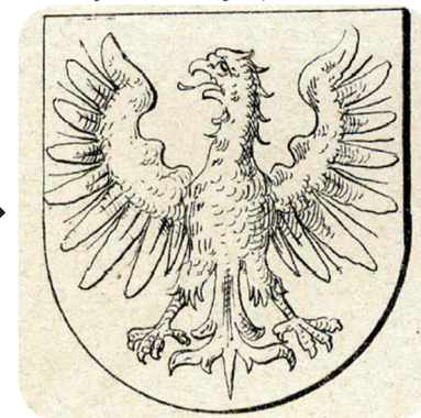
14. Siebmachov grb iz 1885 (Siebmacher, J. Siebmacher's grosses und allgemeines Wappenbuch). Siebmacher's coat of arms from 1885 (Siebmacher, J. Siebmacher's grosses und allgemeines Wappenbuch).