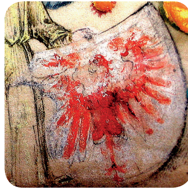
3. Drugi grb v antifonariju (NŠAL 102, a. e. 19, š. 10). The second coat of arms in the antiphonary (NŠAL 102, a. e. 19, š. 10).