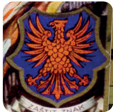
24. Znak Jugočeške iz 20. let 20. stoletja (Stalna razstava Prelepa Gorenjska).

The symbol of Iska from the 1930s (the permanent exhibition Beautiful Gorenjska).