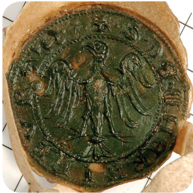
1. Pečat iz 13. stoletja (ARS, 1508 VI 3). A seal from the thirteenth century (ARS, 1508 VI 3).