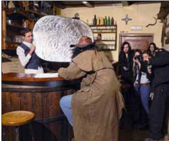
Zopet se je snemalo pri nas - tokrat kadri za film »Za nekaj litrov vode«