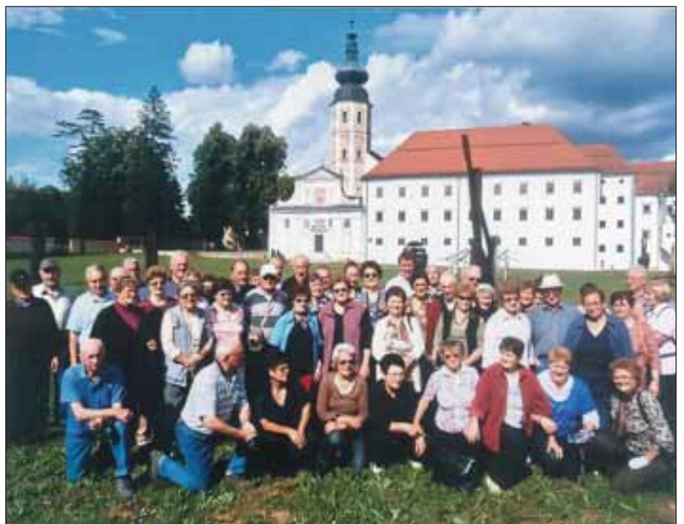
Izletniki pred samostanom v Kostanjevici

Pripis: Zahvaljujemo se Prosnikovim za popotnico s središkim kruhom.