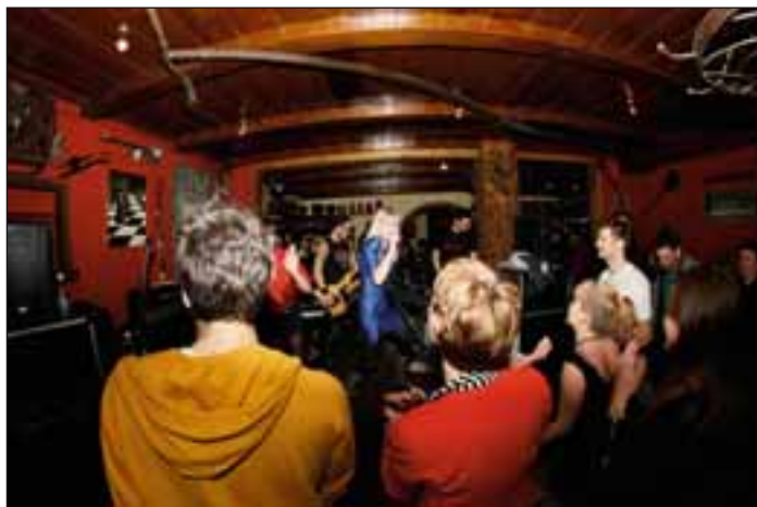
Lollobrigida, hrvaško - slovenska koncertna atrakcija, ki polni odre po Balkanu