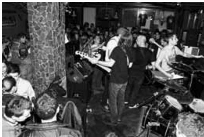
Marčevsko rajanje z Mariborčani Happy Ol' McWeasel