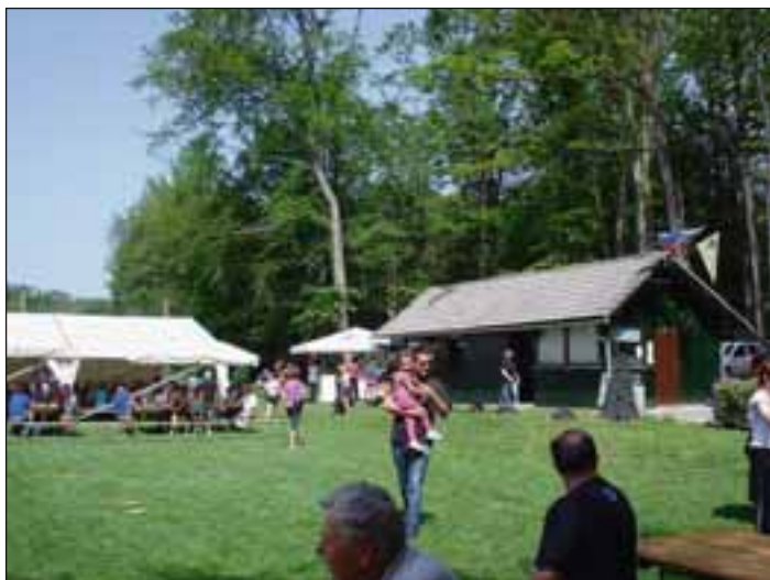
Vreme nam je bilo naklonjeno.

Tudi letos je, kot že nekaj let zapored, na igrišču Rekreatijskega društva Godeninci potekalo praznovanje 1. maja, ki smo ga pripravili v sodelovanju z občino. Čeprav je bil ta dan za nekatere delovni, smo vsi skupaj uživali in se veselili do večernih ur. Naše druženje se je pričelo ob 10. uri, popestrili so ga starodobniki s steyerji, ki so nas izzvali, da smo z njimi tekmovali v vleki vrvi. Poseben izziv