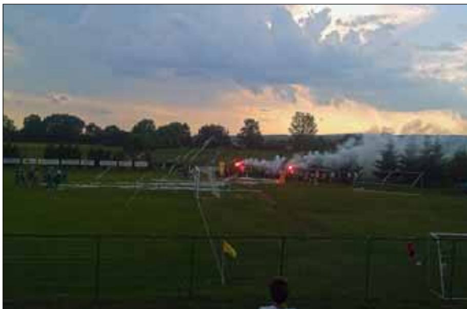
Slavje po zmagi nad Ormožem

Čestitke gredo tudi vsem mlajšim selekcijam ter njihovim staršem in trenerjem - mladi nogometaši so zagotovilo, da se bo dober nogomet v kraju igral tudi v prihodnje; tisti, ki jih spremljate, veste, da igrajo iz leta v leto bolje. O njih bomo obširneje poročali v jesenski Sredici.