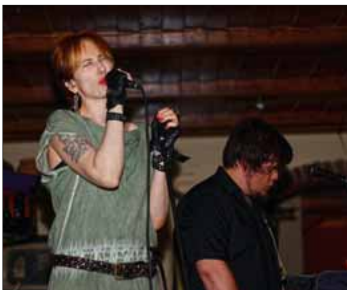
Werefox, nove zvezde na slovenskem (alternativnem) rockerskem nebu