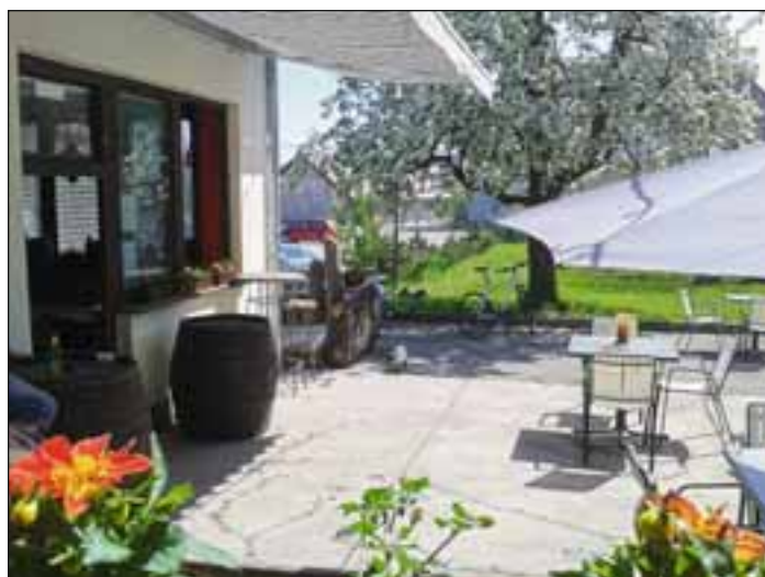
Utrinek s terase