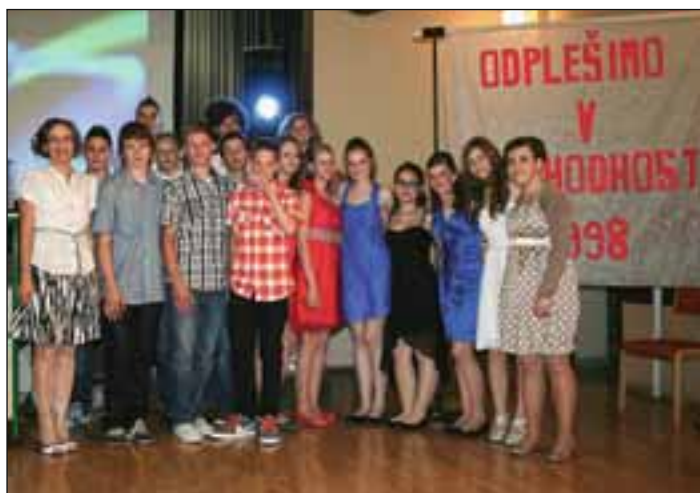
Generacija 1998 zapušča osnovnošolske klopi.