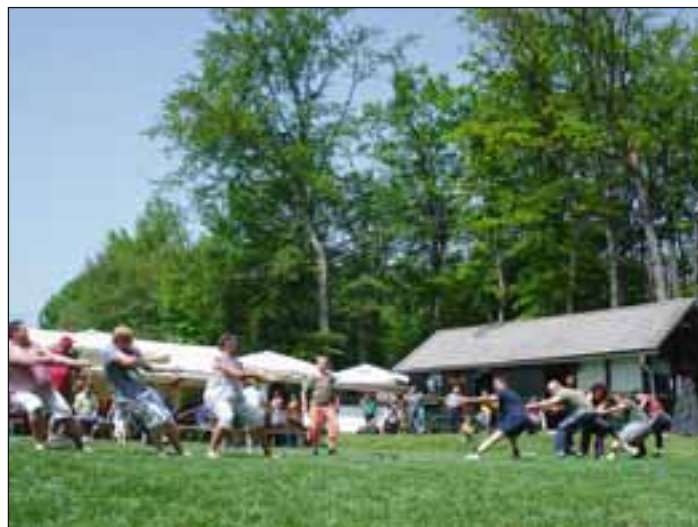
Vleka vrvi za »gajbo piva«.

so namenili godeninskim ženskam, in sicer smo tekmovali proti najmanjšemu traktorju, ki pa smo ga brez težav »potegnile«. V dopoldanskem času nas je obiskala še središka godba, ki nam je odigrala nekaj veselih skladb. Ker nam je vreme pred veliko nočjo zagodlo, da nismo mogli kuriti kresa, smo to storili ob koncu tega čudovitega dne.