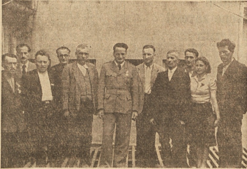
Naš delavski razred se ima v veliki meri osebno zahvaliti tovarišu Kidriču, da je v teh zadnjih letih delavstvo s tolikimi uspehi prevzemalo upravljanje v svoje roke. Zato ne bo mogel preboleti izgube, ki ga je z njegovo smrtjo prizadela. — Tovariš Boris Kidrič med predstavniki oblastvenih vodstev in političnih organizacij po velikem zborovanju mari borskih delavcev v juniju 1945

ročevalec zadržal na goli graji obstoječega stanja. Vsekakor je današnji način upravljanja železnic že tako družbeno preživel, da postaja že politično vprašanje, saj skušajo nekateri posamezniki ustvariti med železničarji nezaupanje v delavsko samoupravljanje na železnicah sploh in ustvariti med železničarji mlāčnost in nezanimanje za gospodarjenje.