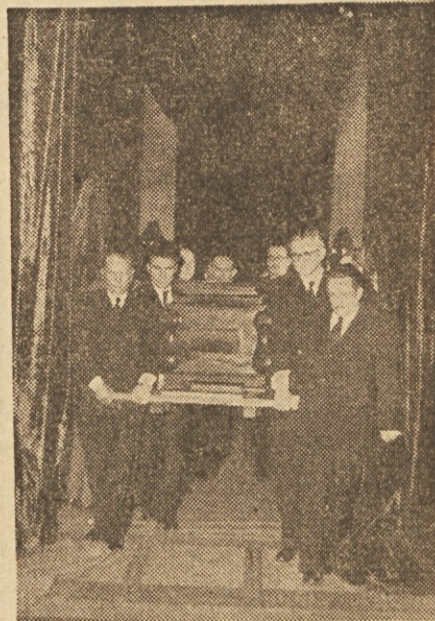
Najboljši Kidričevi prijatelji, njegovi zvesti sodelavci so nosili krsto s pokojnikovim truplom

V istem poslopju zaseda Zvezni Izvršni svet. Govori Moša Pijade: ... Boris Kidrič je umrl v času, ko bi ga naša družba najbolj potrebovala.