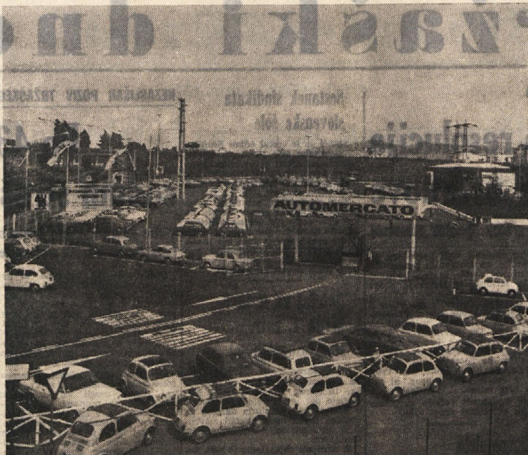
Na robu Rima, vendar pa ob eni izmed zelo prometnih in za promet praktičnih krožnih cest je družba FIAT odprla »Automercato«, to je nekakšen sejem razbiženih avtomobilov. Morebitnemu kupcu so na razpolago najrazličnejši tipi vozil, kakor kaže naša slika

Je bil že dolgo vedno za korak dva pred splošno linijo. Verjetno zato, da bi s tem dokazal, da tisti, ki so po vrstnem redu pred njim, dejansko v svoji revolucionarnosti zaostajajo, da so glede revolucionarnosti za njim in da mu torej pripada mesto v najvišjem vodstvu dežele.