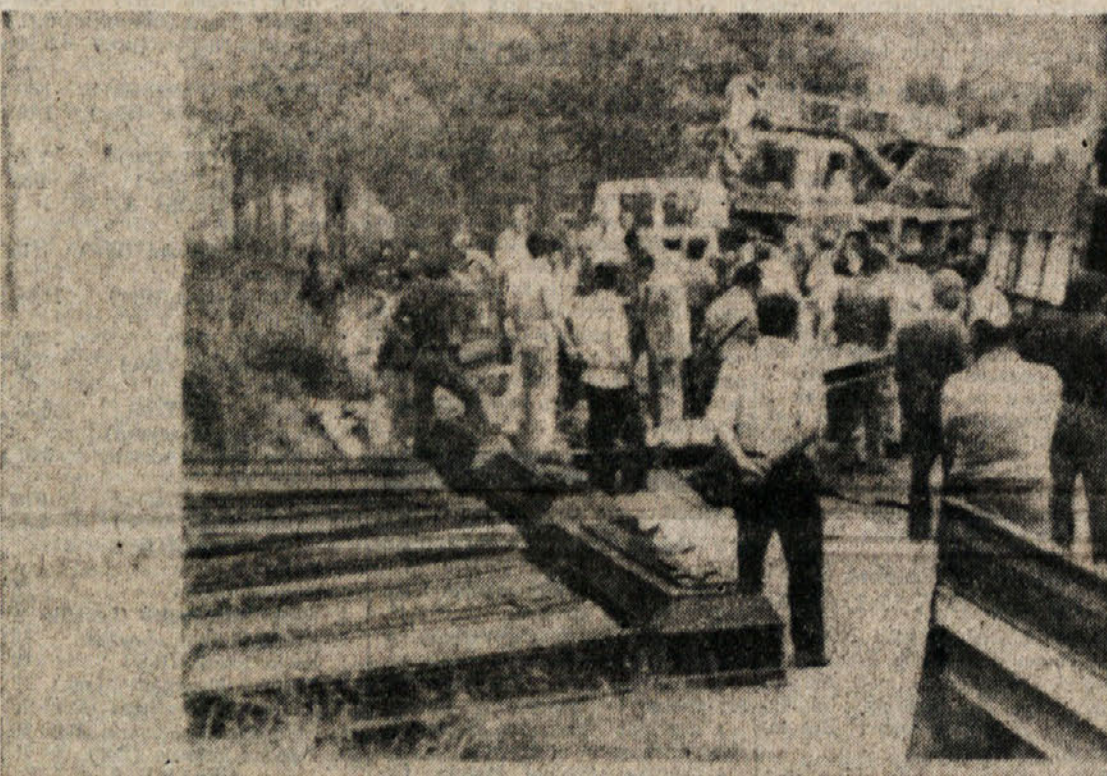
V severnem delu španske pokrajine Hnesca se je pripetila strahovita prometna nesreča. Avtobus s 60 potniki je iz doslej še nepojasnih razlogov strmoglavil v globok prepad, pri čemer je bilo 24 oseb ubitih, nadaljnjih 30 pa bolj ali manj hudo ranjenih. Usoda preostalih potnikov ni še znana. Pristojne oblasti so uvedle strogo preiskavo o vzrokih nesreče. Na sliki: polaganje posmrtnih ostankov v krste