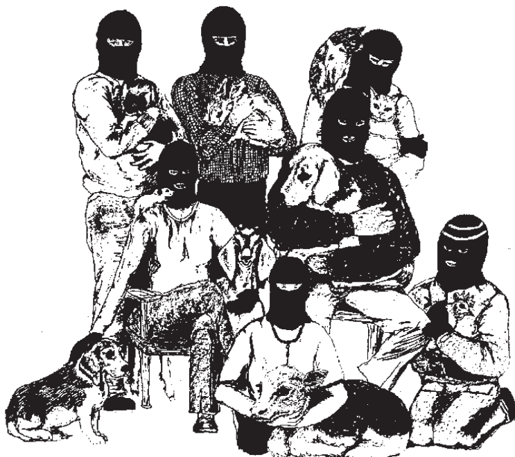
Iz glasila ALF