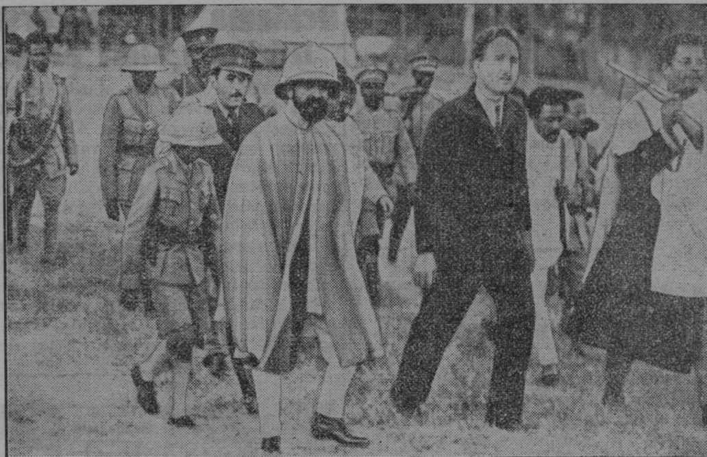
Abesinski cesar na poti k Abesincem, ki sobili ranjeni v Desije od italijanskih zračnih bomb.

grenka voda zaprtje spodnjih organov dobro in naglo. Mnogoletne izkušnje uče, da poroba Franz Josefove vode izbornu urejuje funkcije črev. Reg. po min. soc. pol. in nar. zdr. S-br. 15485, 25. V. 1935.