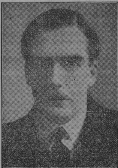
Novi angleški zunanji minister A. Eden.

šolskimi potrebščinami. Niti eden ni šel prazen iz šole. Prav lepa zahvala vsem, ki so pripomogli k tako izdatni božičnici.