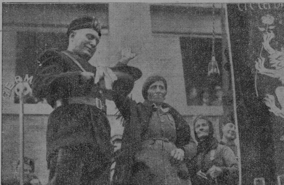
Mussolini zbira v svojo bronasto čelado zlate darove za vojno.