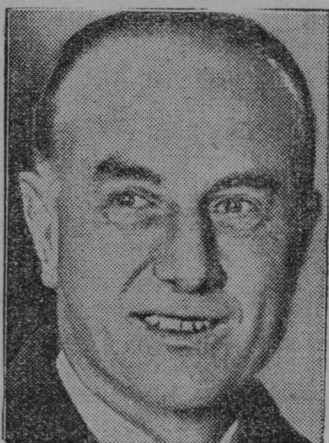
Bivši angleški zunanji minister S. Hoare.