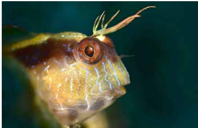
Čudoviti podvodni svet Grege Verča

Dela so se lotili z zrcalnorefleksnimi (DLSR) ali kompaktnimi fotoaparati v zaščitnem ohišju. Po preteku odmerjenega časa so morali tekmovalci oddati spominsko kartico, na kateri je lahko bilo največ 100 podvodnih fotografij, sledilo pa je izbiranje posnetkov in predaja tekmovalnih fotografij, ki so jih lahko tekmovalci enako kot lani pred oddajo v aparatu še popravljali z obrezovanjem, barvnimi korekcijami in podobnim. Za vsako kategorijo je lahko tekmovalec oddal le po en posnetek. Tričlanska žirija, ki so jo sestavljali znana slovenska pod-