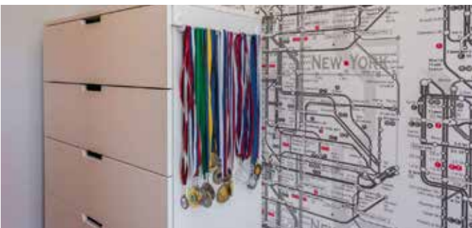
Fantovska soba je po namestitvi ostanka tapet, ki so ga lastniki odkrili v eni od specializiranih trgovin, videti čisto drugače.

Tudi brez ostankov tapet si lahko vsakdo privoščiti tako stensko dekoracijo. Stena s tapeto je lahko celo tako atraktivna, da nanjo ni treba obešati slik, zadostuje morda kakšno izbrano ogledalo, zelo moderna so ta hip okrogla, in že bo stena zaživela v novi luči.