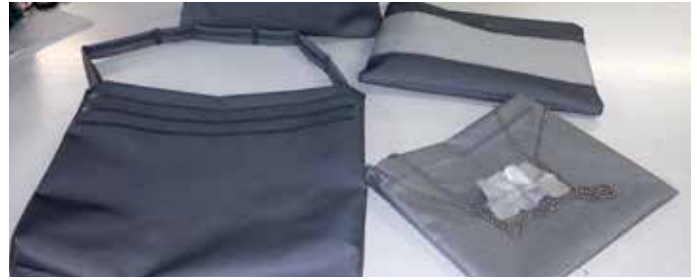
Iz odpadnih senčil je študijska skupina za trajnostno oblikovanje izdelala med drugim tudi prikupne torbice.