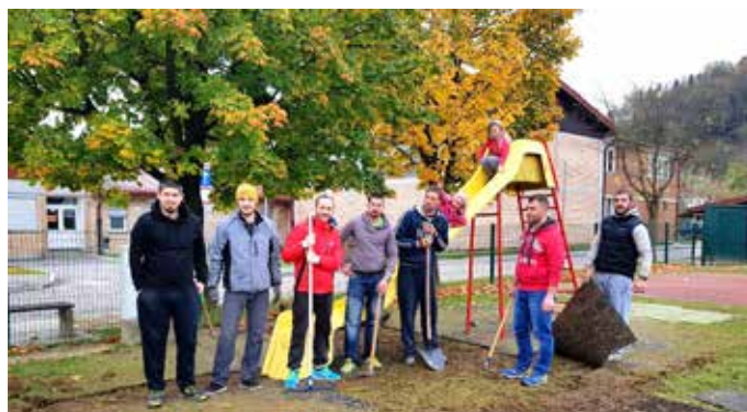
Skupinska fotografija vseh prostovoljcev, ki so se udeležili delovne akcije Športnega društva Trzin.