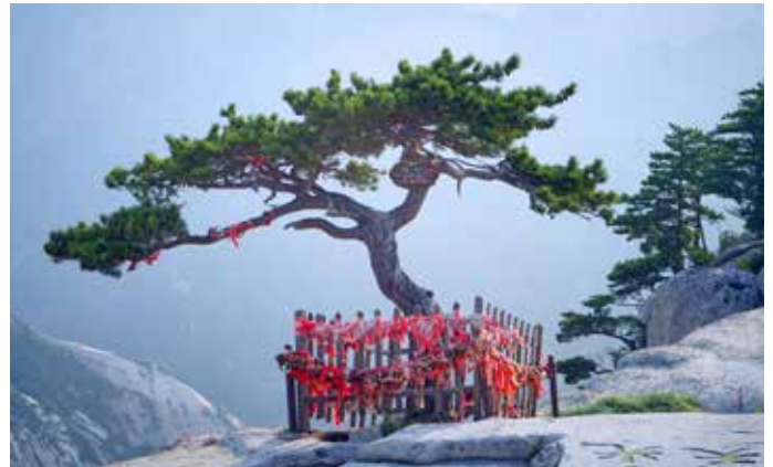
Slikovit prizor s svete gore Hua, kjer posredujejo romarji z barvitimi trakovi in ključavnicami (žabicami) svoje želje božanstvom.

In prav to mu je povzročalo preglavice tudi ob vznožju gore Hua, ene od petih kitajskih svetih gora. Za razliko od njegovih sopotnikov, ki so se