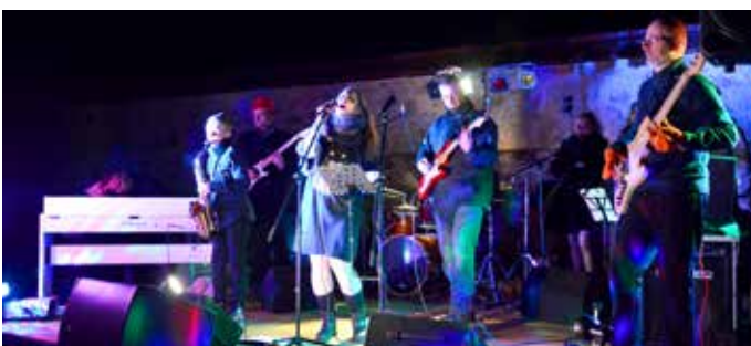
BUČni koncert skupine Karsmreklasmrekla