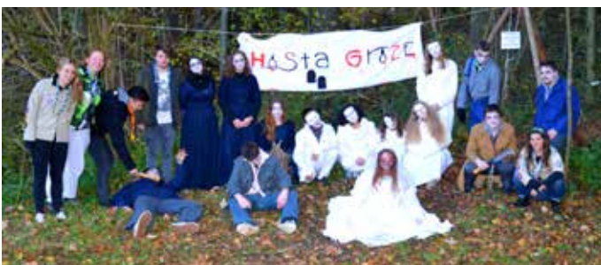
Nekaj duhov, ki so strašili v hosti groze, in nekaj pomočnikov – prizadevnih tabornikov, ki so pomagali izpeljati to imenitno atrakcijo zabave.