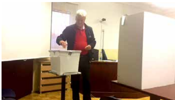
Na tokratni občinski seji so svetniki na koncu glasovali za elektorja v volilnem telesu volilne enote št. 2 na volitvah 2017 za predstavnika lokalnih interesov v Državnem svetu.