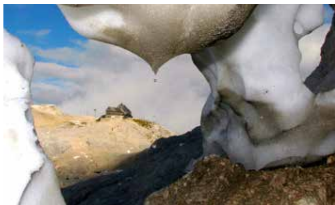
Triglavski dom na Kredarici izpod zgornjega roba Triglavskega ledenika poleti, na vrhuncu talilne sezone.