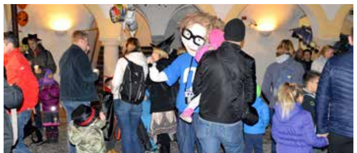
Pestro dogajanje na grajskem dvorišču. Otroke je med drugim zabavala tudi prikupna maskota Modrih novic, ki so bile medijski sponzor dogodka.