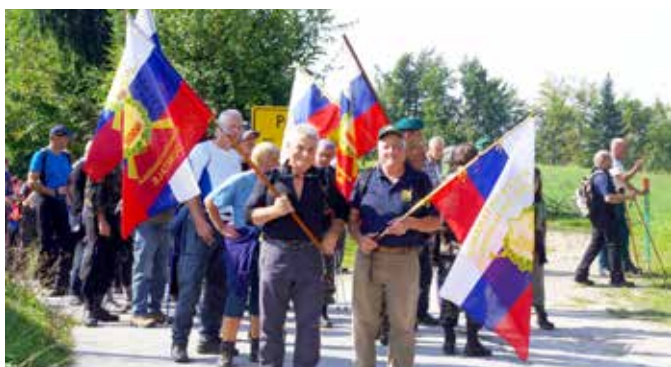
Na poti po zeleni naravi

Veterani vojne za Slovenijo se vsako leto podamo na pohod v spomin na osamosvojitve naše države. Letos je bil zbor pri gradu Brdo nad Lukovico. V še dokaj meglenem jutru se nas je tu zbralo kar lepo število, saj so bili poleg domačinov z nami tudi veterani iz Ljubljane, Logatca, z Vrhnike, iz Litije, Grosuplja in Ribnice.