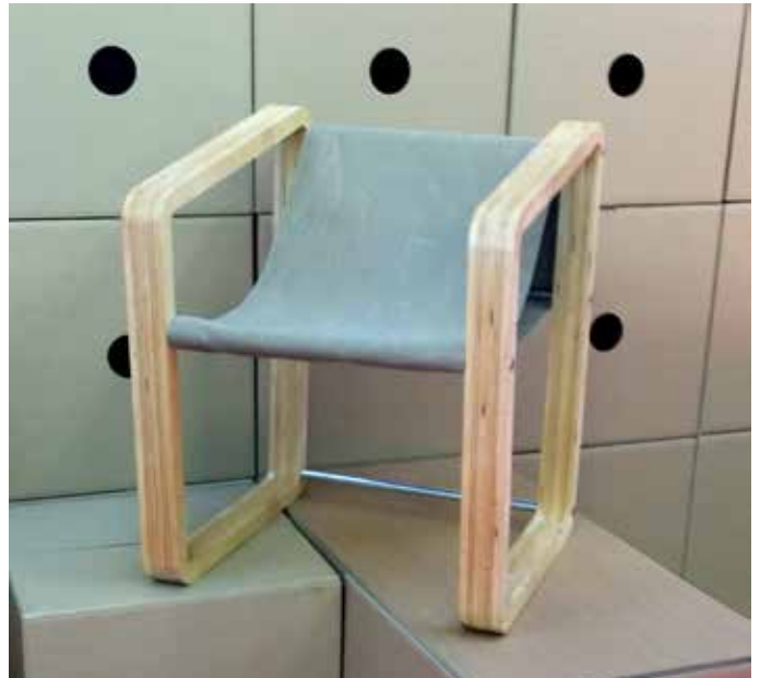
Imenitni stol, ki je navdušil tudi stroko in obiskovalce letošnjega meseca oblikovanja.

Vsestranska ustvarjalka nenehno razmišlja, kako bi s svojim delom dvignila kakovost življenja, zato ne preseneča, da je njen prvi študijski krožek zaznamovalo trajnostno oblikovanje. Za začetek se je povezala s podjetji, s katerimi sodeluje tudi pri svojem osnovnem delu, in prav vsa so ji rada priskočila na pomoč. »Številna trzinska in druga okoliška podjetja so krožku, v katerem smo se združili ljudje različnih starosti in poklicev, darovala odpadni material, od lesa do blaga in še česa. Potem pa smo se navdušeno lotili dela,« opisuje začetno fazo ustvarjanja, v kateri še niso dobro vedeli, kaj bo nastalo iz njihovih prizadevanj. A materiali so jih tako nagovorili, da so se člani krožka preprosto prepustili ustvarjalnemu zanosu in domišljiji in na koncu so iz kosov nič vrednih odpadkov nastali prav imenitni uporabni izdelki.