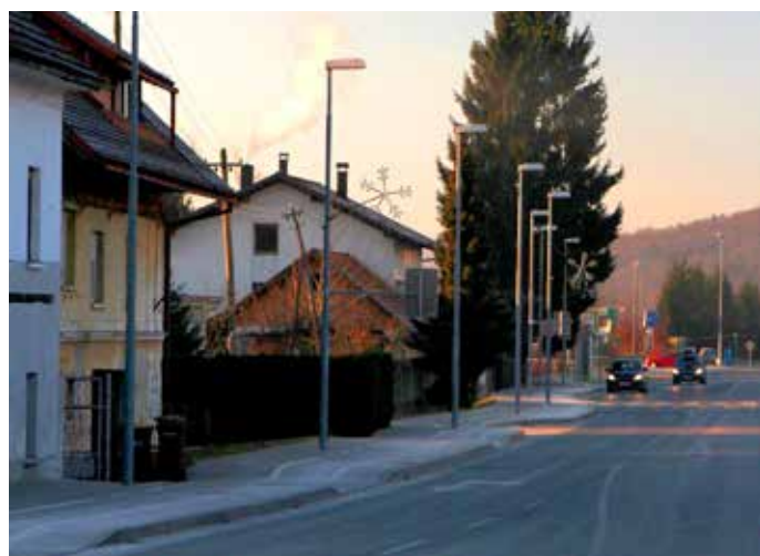
Tudi iz nekaterih trzinskih dimnikov se včasih pošteno kadi.

Ta prispevek je torej namenjen vsem tistim, ki vržete v domačo peč kaj »trdega«, pa naj bodo to premog, drva, lesni peleti in briketi, sekanci, ostanki drevja in lesa, žagovina in kar je še podobnih energentov ali pa njihova kombinacija, kajti tudi na območju Trzina lahko vse pogosteje opazimo, da se posamezniki ne ozirajo na okolico (beri sosedo) in vremenske razmere in vržejo v svojega »gašperčka« tako rekoč vse, kar jim pride pod roko. Že res, da je pri marsikom gospodarska kriza v minulih letih posegla globoko v žep, a to ni opravičilo za to, da imamo v nekaterih delih Trzina zaradi enega ali nekaj brezvestnih posameznikov pogosto opraviti s krajšimi, včasih pa tudi dalj časa trajajočimi dimnimi stebri in celo pravimi dimnimi zavesami in tudi primere, ko dim prebije tako imenovano zaporno plast oziroma višino, do katere sega temperaturni obrat, in se razprši v okolico, in smo tako deležni »le« njegovih finih delcev, to je ostankov energenta. Pozimi je namreč temperatura zraka pri tleh pogosto nižja kot nekoliko nad tlemi, čemur pravimo temperaturni ali toplotni obrat oziroma temperaturna inverzija.