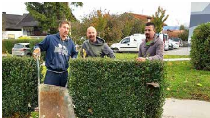
Delu se je kot vedno z veseljem pridružil tudi naš župan.