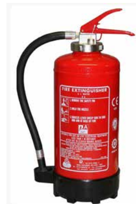
Gasilnik na vodo.

Princip gašenja s peno je predvsem dušenje, edina pomanjkljivost teh gasilnikov pa je električna prevodnost pene, kar je posledica v peni vsebovane vode. Pene zato ne uporabljamo za gašenje požarov na napravah pod električno napetostjo in električnih instalacijah.