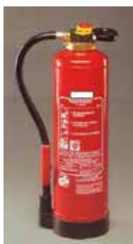
Gasilnik na peno.

Za doseg hladilnega učinka pa mora biti voda pravilno uporabljena, in sicer tako, da se s področja gorenja oziroma gašenja z vodo dviga para. Uparjena voda namreč s svojo povečano vodno površino veže toploto in tako ohlaja gorljivo snov. Če pa voda z mesta gašenja požara odteka v potokih, lahko sklepamo, da gre za nepravilno uporabo vode. Za gašenje požara je treba vodo razpršiti v fine vodne kapljice, ki se potem med padanjem skozi plamene spremenijo v paro. S tem se omeji pretirana poraba vode, zmanjša pa se lahko tudi škoda na potencialnem gorivu, to je materialu, ki ga ogenj še ni dosegel.