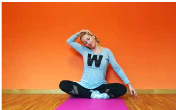
Petra med vadbo

In kako sama poskrbi zase in za drobne radosti? Vsako jutro se s svojim kužkom odpravi na sprehod in vsak dan izvaja tudi obrazno jogo. Kadar nima veliko časa, zadostuje že deset minut vadbe, pravi.