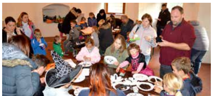
Ustvarjanje v prostorih grajske kuhinje