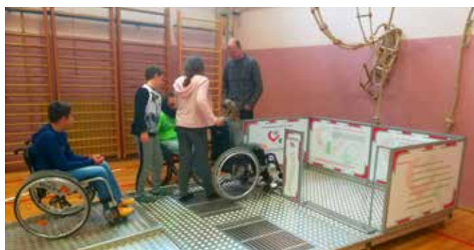
Trzinski šestošolci med preizkušanjem vožnje z vozički po poligonu

Rok Bratovž, foto: arhiv Društva paraplegikov ljubljanske pokrajine