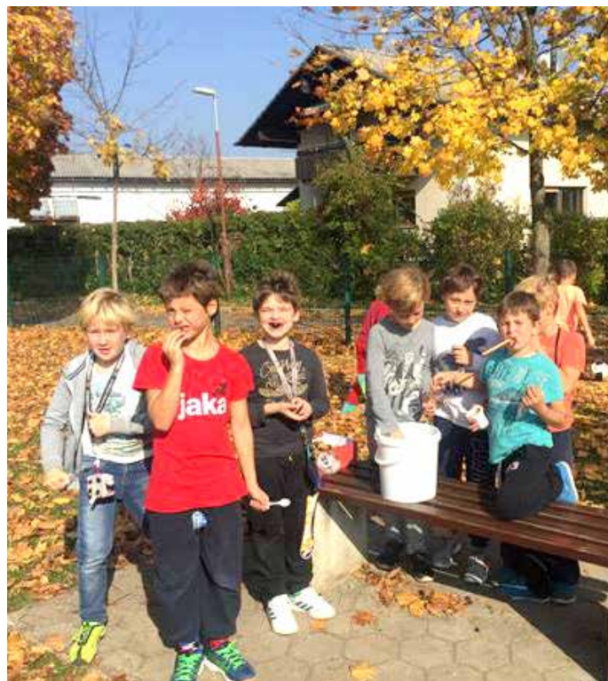
Nasmeh na obrazu in poln trebušček kostanja