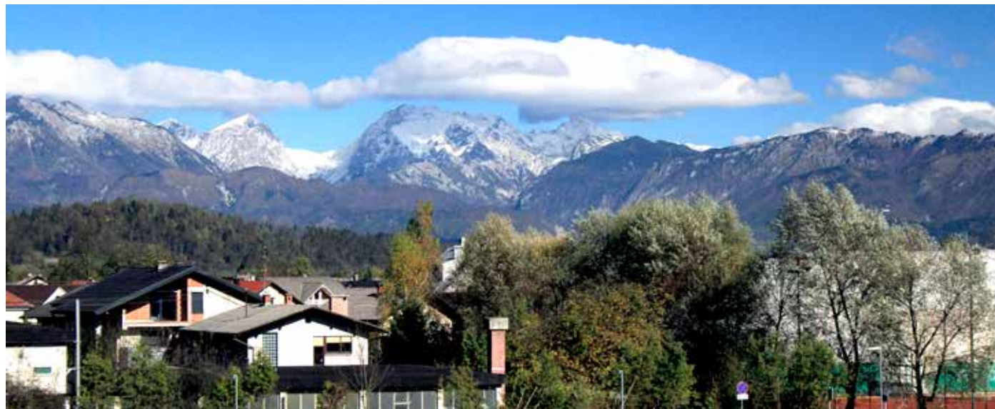
Oktobrsko vreme je bilo radodarno s soncem kot že dolgo ne, temu primerni pa so bili tudi trzinski razgledi.

Lepo vas prosim, se po takem, od sonca razvajanem oktobru sploh še kdo spomni nemarno mokrega septembra? Toliko padavin, kot jih je bila septembra najvišja dnevna količina, jih je bilo oktobra v celem mesecu. Septembrskih 210 litrov na kvadratni meter smo v preglednici izpustili, saj so si zaslužili posebno omembo v besedilu, tokrat pa vam žal ne moremo postreči z nobenim dih jemajočim podatkom. Ali pač, morda s tem, da smo v kar dveh dneh zabeležili isto, in to sploh najvišjo dnevno temperaturo zraka.