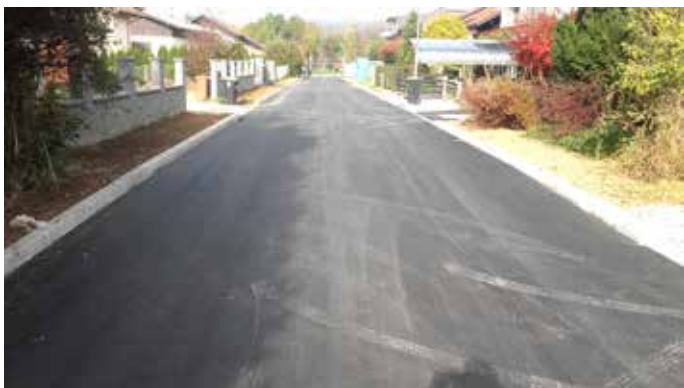
Obnovljeni Zupančičeva in Jemčeva ulica