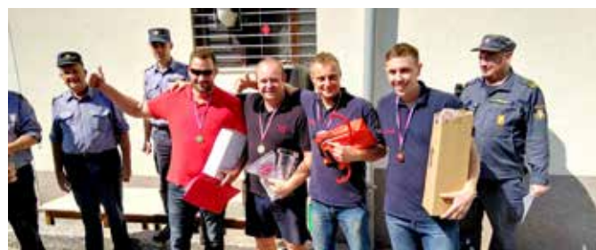
Zmaga naših fantov na gasilskem taktičnem tekmovanju v Rogaški Slatini