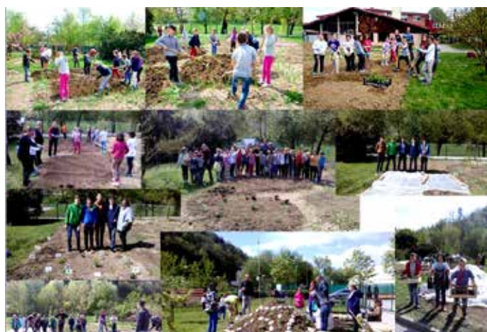
Predstavitvena fotografija ekovrtnarjenja OŠ Trzin, ki so jo izdelali učenci za jesenski seminar programa Šolski ekovrtovi.