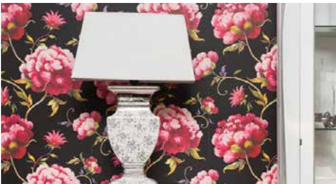
Kotiček v dnevni sobi bo s takšno tapeto na novo zaživel.

Danes so tapete izdelane večinoma iz naravnih materialov, kot so papir, bambus, svila in drugo blago ter podobni materiali. Obstajajo vzorci za vsak okus, nekatere od tapet pa so lahko tudi zgolj »teksturane«. Zelo priljubljene so tudi fototapete, strokovnjaki pa nam lahko na tapeto natisnejo celo izbrano fotografijo ali vzorec po naši želji. S tapeto si lahko polepšamo kotiček v stanovanju, z njo lahko poudarimo zgolj eno steno, poživimo nišo ..., obenem pa so tudi odlična zaščita in hkrati dekoracija, na primer ob postelji, predvsem na steni z vzglavjem.