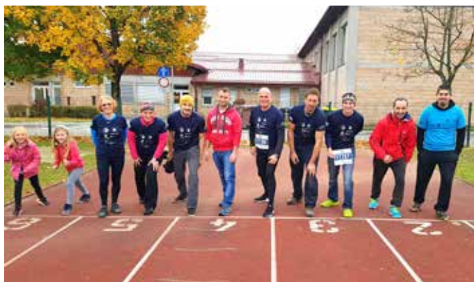
Člani ŠD Trzin so se dan pred ljubljanskim maratonom takole ogrevali in se bodrili za svojo tekaško preizkušnjo.