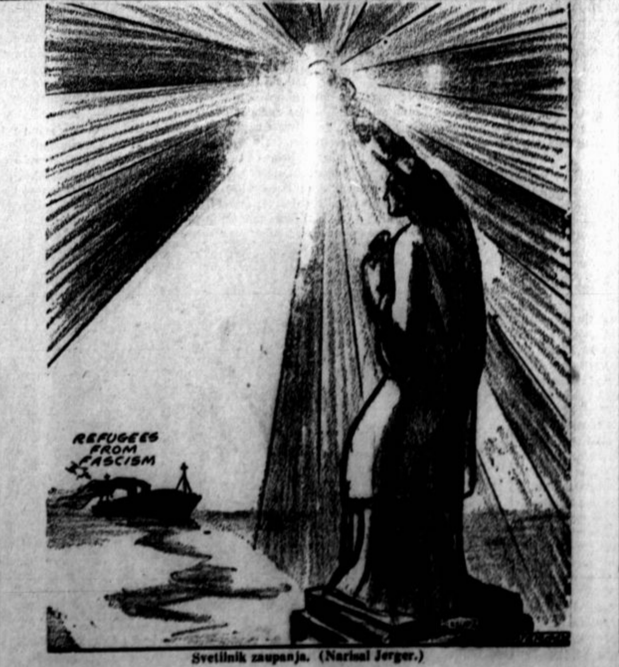
Svetilnik zaupanja. (Narisa! Jerger.)

Kljub demobilizaciji rezervne armade ne bo češkoslovaška oborožena sila dosti zmanjšana. Fantje, ki so bili potrjeni v tem letu, bodo takoj stopili v službo. Avtoritete zdaj sestavljajo tudi zakon, da se obvezna vojaška služba podaljša na tri leta.