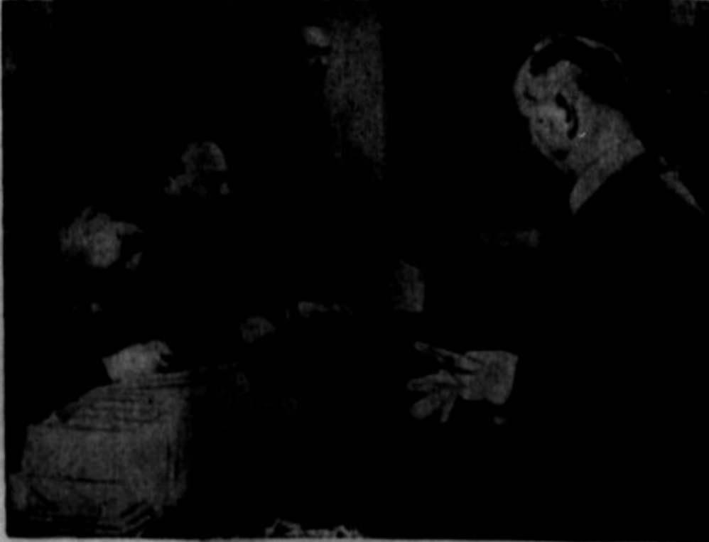
Edvard Beneš, predsednik Češkoslovaške, v volilni koči v Pragi. Običinske volitve so bile mir- ne, čeprav so se ališale groznje, da bo Nemčija invadirala češko republiko.

Sovjetska Rusija. Iz Londona poročajo, so se ruski veleposlaniki zahvalili kajzerju okupacijo Bele Rusije.