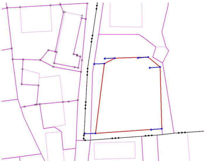
Slika 5: Prikaz območja istovrstnega vzdrževanja zemljiškokatastrskega prikaza v sosednjih katastrskih občinah

Na sliki 5 je zemljiškokatastrski prikaz na stiku katastrskih občin. Na območju leve katastrske občine so zemljiškokatastrske točke brez vektorjev. Če bi s transformacijo prilagodili zemljiškokatastrski prikaz, bi nastale velike deformacije. Po primerjavi z ortofoto načrtom se lahko sklepa, da so vektorji v desni katastrski občini odveč. Iz analize zbirke listin sklepamo, da pri parcelaciji niso bili upoštevani vsi zemljiškokatastrski podatki.