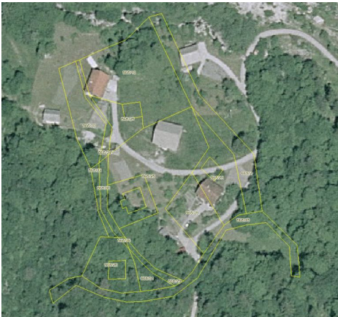
Slika 1: Izvorni zemljiškokatastrski prikaz

Na neskladja med podatki naletimo pri vseh dobaviteljih. Kljub informacijskemu razvoju v zadnjih desetletjih je v arhivih upravljavcev veliko analognih podatkov. Posebna težava so tisti, ki nimajo podlage za geolociranje vsebin v državni koordinatni sistem.