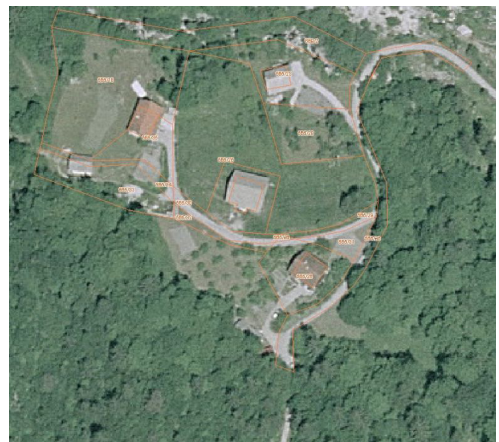
Slika 2: Zemljiškokatastrski prikaz po vklopu na načrt ortofoto