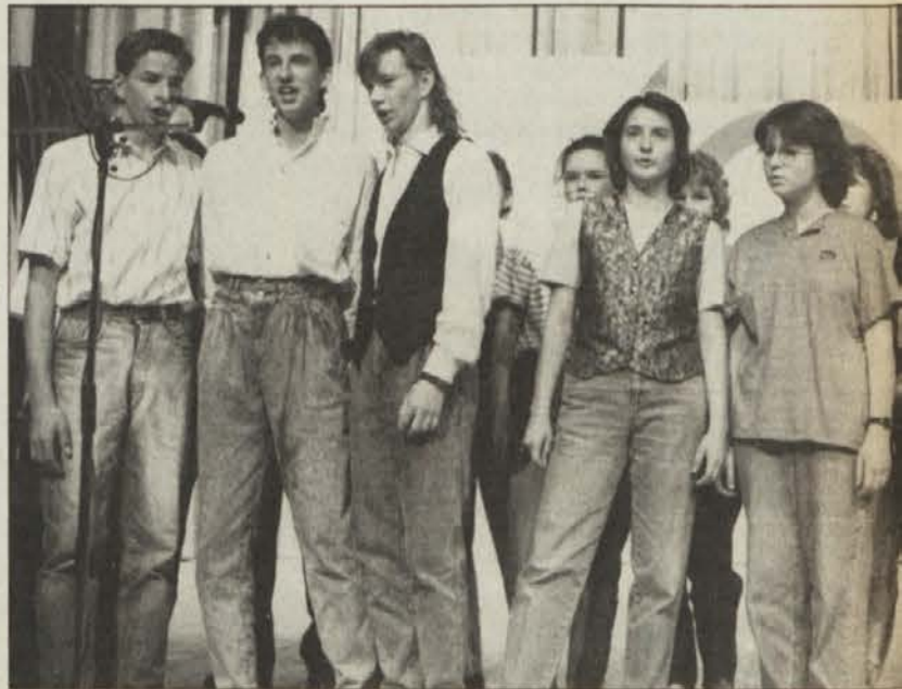
Pevska skupina 6. a razreda je ob spremljavi klavirja in violine zapela