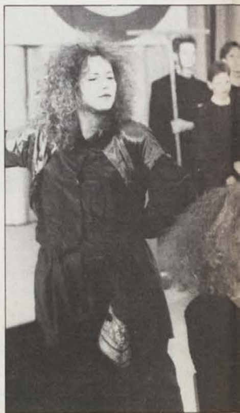
V ospredju fine dame francoske buržoazije