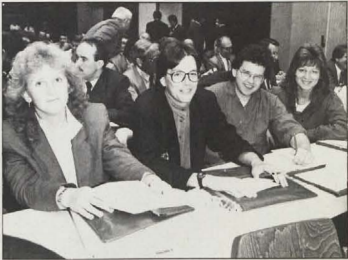
Največ diskusijskih prispevkov so imeli mladinski zastopniki.