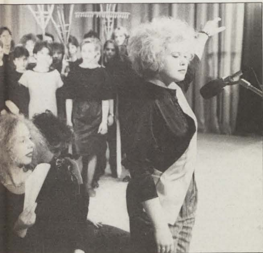
Bojaznje – v ozadju lačno in uporno ljudstvo.