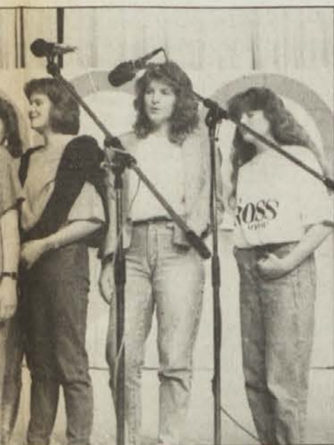
Bela znano judovsko pesem „Dos Kelbi“