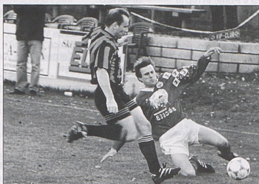
Jesenski poraz (0:1) na domačem igrišču proti Metlovi (na sliki Dlopst in Kues) želijo Bilčovščani v soboto (ob 17.30) popraviti.

V zadnjem krogu morajo Bilčovščani v Metlovo, ki je v vignetnem delu prvenstva več razočarala kakor nasprotno.