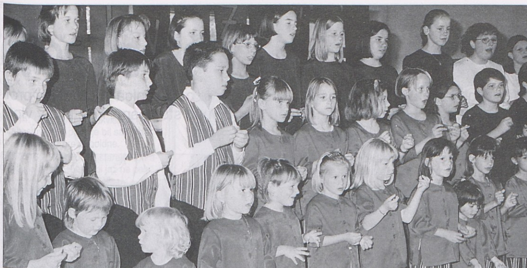
Otroški zbor "Živ-Žav" je praznoval in predstavil CD-ploščo. Za jubilej so starši in društveniki poskrbeli za nove obleke otrokom, čestitala pa sta tudi Mlada Podjuna in Amabilis iz Galicije (sliki desno).