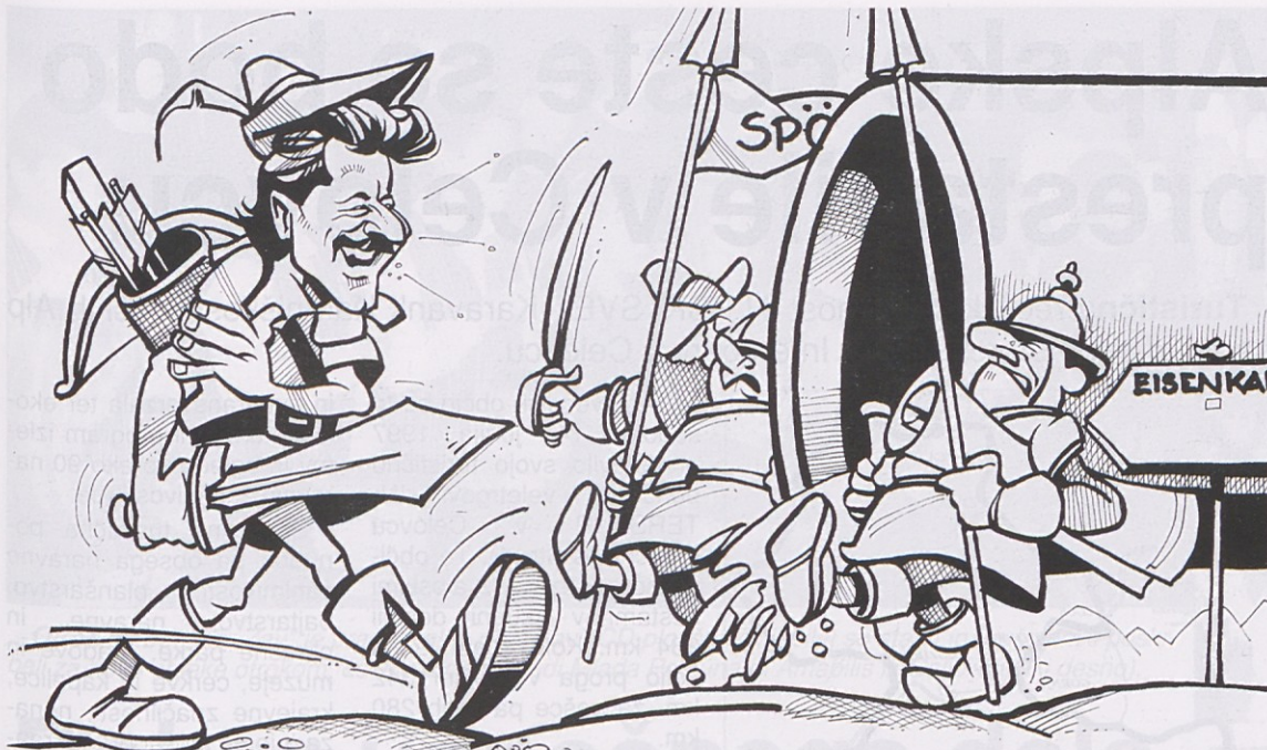
Naš karikaturist se sprašuje, ali bodo v Železni Kapli že kmalu potrebovali modernega občinskega Robina Hooda, ki bo ščitil občane pred ogromnimi izdatki za kanal, ki ga želi graditi koalicija SPÖ/ÖVP?