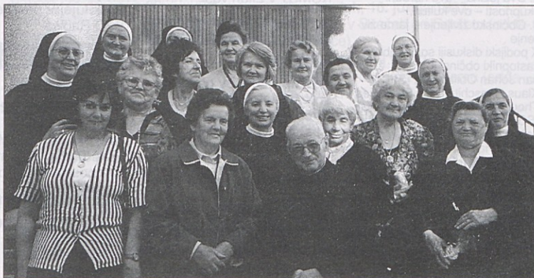
Srečanje učenk gospodinjkega tečaja 1951/52 z še živečimi sestrami in učitelji.

Vse zamujeno so obnovile v veselem klepetu ob dobro založeni mizi. Kakor v filmu so se vrstila življenjska pota posameznih, ko so v pripovedovanju zaupale vse lepo, pa tudi hudo, kar so pač sprejemale kot dar življenja iz Božjih rok 45 let. Možje, poroke, otroke, pa tudi že vnuki so vsem živ dokaz bolj ali manj uspešnega izpolnjevanja živ-