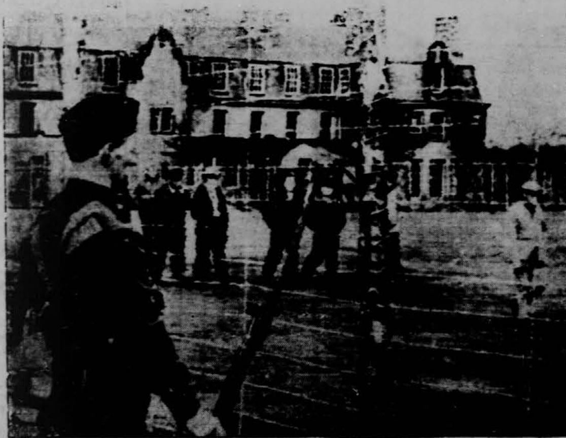
Angleški vojak stoji na straži poleg omreženega taborišča, v katerem so internirani Nemci za dobo sedanje vojne z Nemčijo. Večinoma so Nemški letalci, ki so bili prisiljeni pristati zaradi poškodbe letal na angleški zemlji.