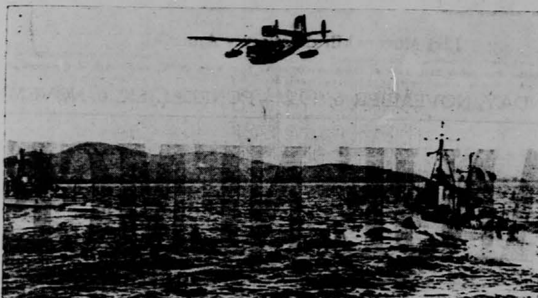
Francoski areoplani in bojne ladje patrolirajo po morju in pazijo na trgovske ladje.