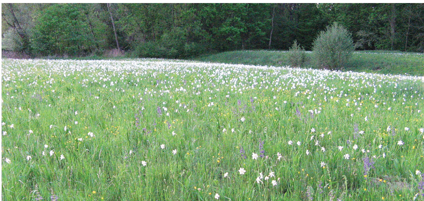
Priznanje družini Ivančič