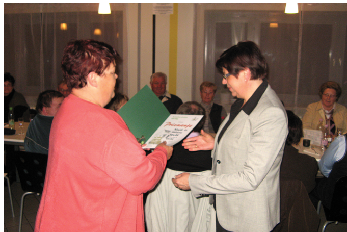
Priznanje družini Belak