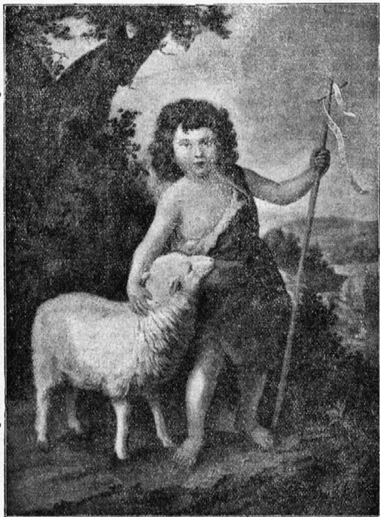
Nebeški zaščitnik Mladih junakov.

„Prosim, oprostite, ne pijem“, se je izgovarjal deček. Mornarji so se smejali, pregovorili pa ga niso. Ko je kapitan (voditelj ladje) za to zvedel, je rekel dečku: „Če hočeš biti pravi mornar, se moraš naučiti piti žganje“.