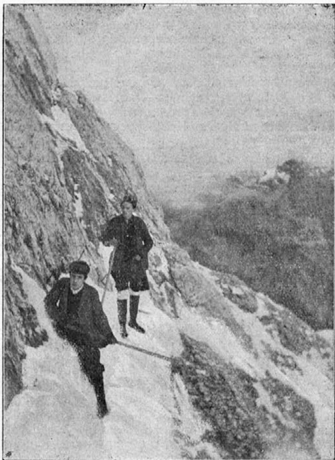
Turisti v triglavskih gorah.