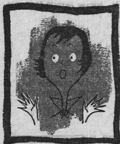
Ko vžigalnik pregori...