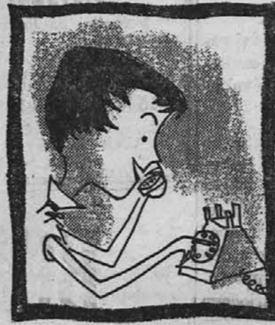
da pokličite Illuminating Company...