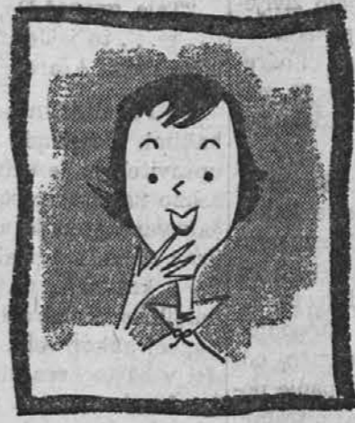
si samo zapomnite...