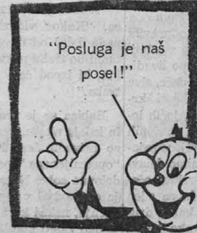
"Posluga je naš pose!"