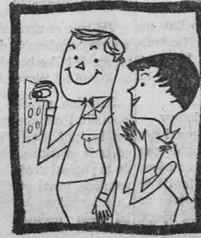
in oni ga zamenjajo brezplačno!