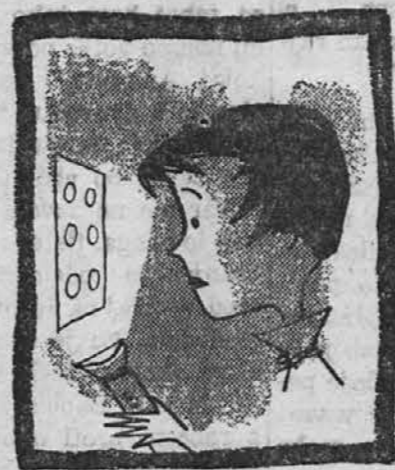
In je vam shramba z vžigalniki zmeda...