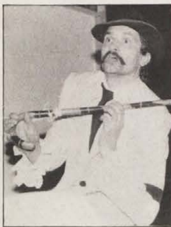
Poleg komičnih smo videli tudi resne prizore kot je razvidno na zgornjem posnetku.

Von den Grünen Sloweniens wurde ein Referendum über die weitere Nutzung der Kernenergie in Jugoslawien vorgeschlagen.