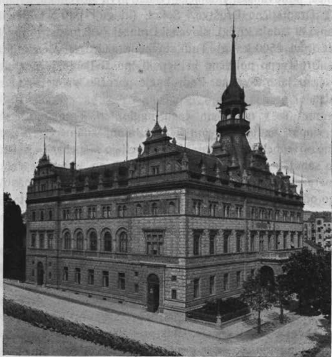
Narodni Dom v Mariboru.

paralelkami, c. kr. višje realke, c. kr. moškega učiteljišča, deželnega ženskega učiteljišča, zasebnega učiteljišča šolskih sester, sadjarske in vinarske šole (v obmestju), trgovinske, obrtniške in gospodinske napredovalne šole, 2 meščanskih šol za dečke in za deklice, 4 javnih ljudskih šol za dečke (ona na Stolnem Trgu se je ustanovila pred l. 1273.) in 2 za deklice, ene deške in dveh dekliških vadnic, varovalnice za dečke in več otroških vrtcev.