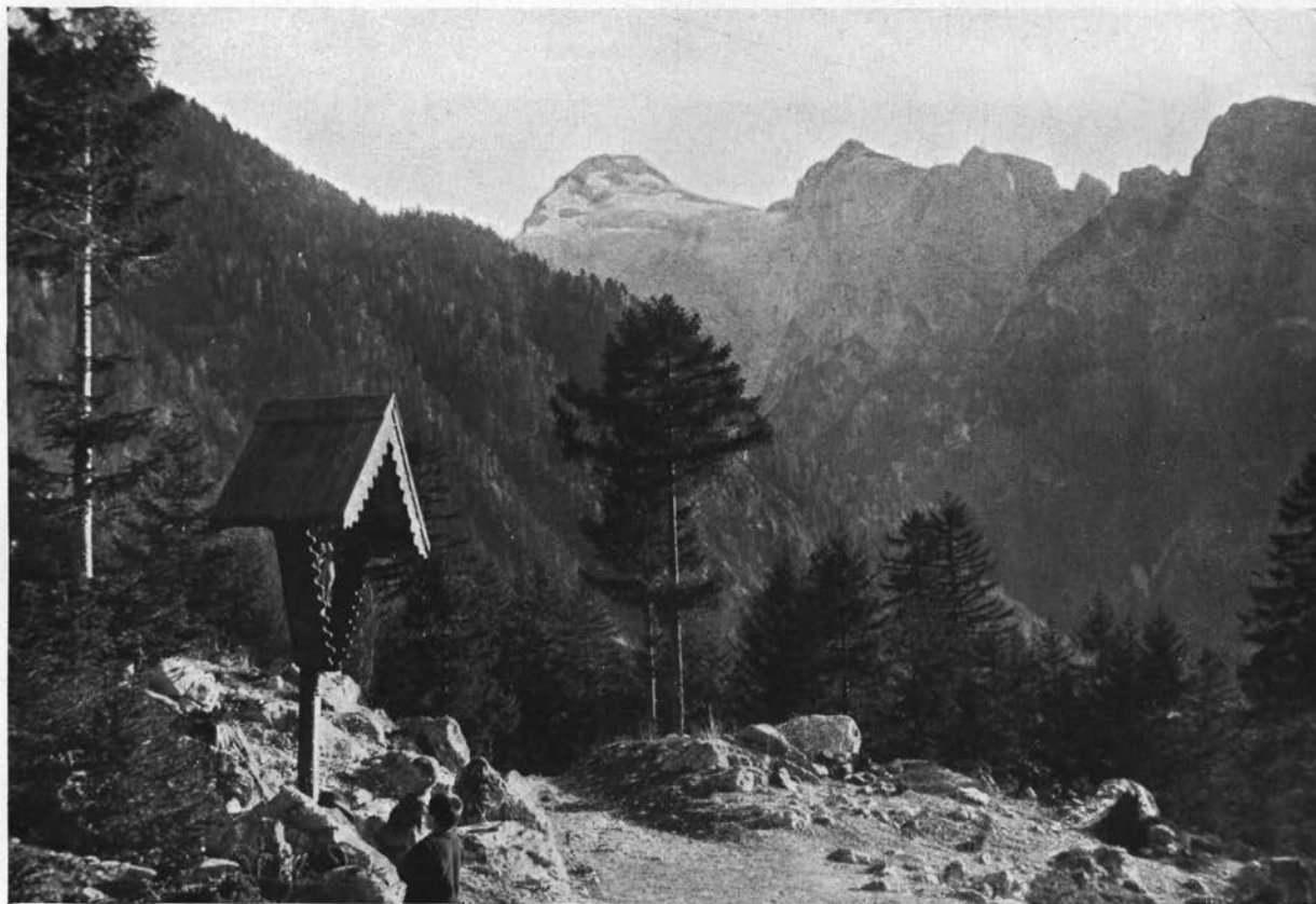
Razór iz Trente.