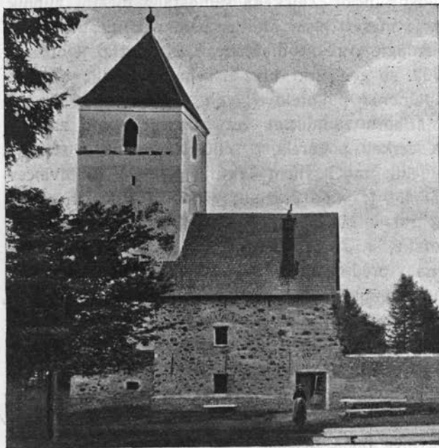
Sv. Bolfenk na Pohorju.

Šola v Limbušu, ki se je osnovala l. 1780, je trirazredna; tukaj je tudi slovenska posojilnica.