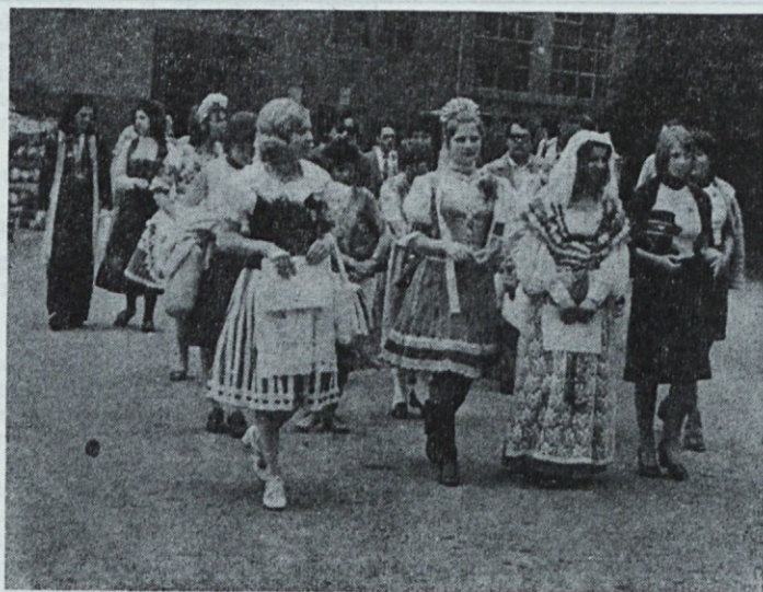
Kmečka ohcet — neveste v IPI; 28. maj