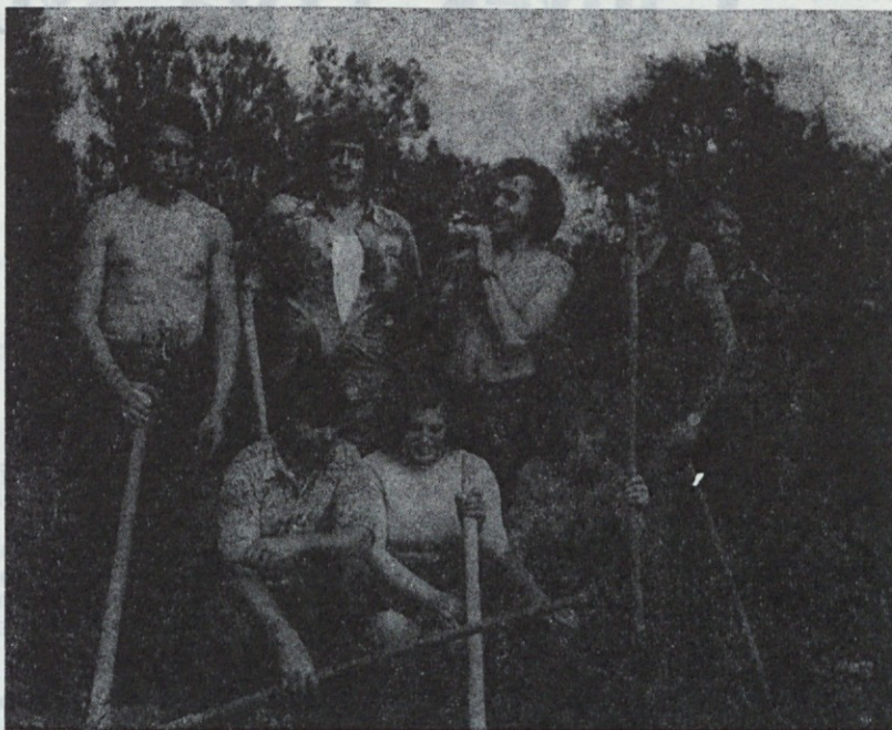
Udeleženci druge delovne akcije mladine in Induplati

Naloga mladine — izkopanje jame za ograjo