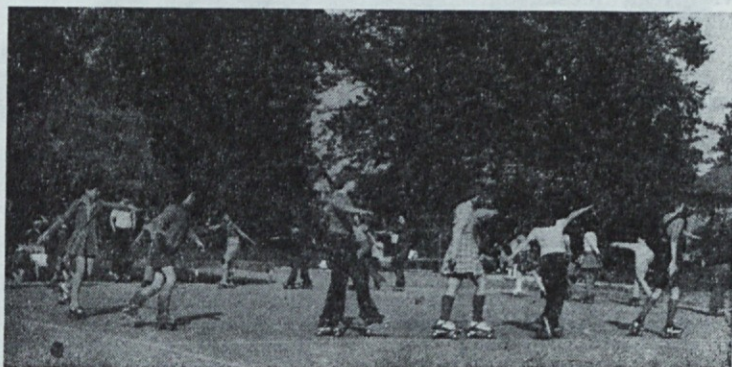
Kotalkarji med vajo