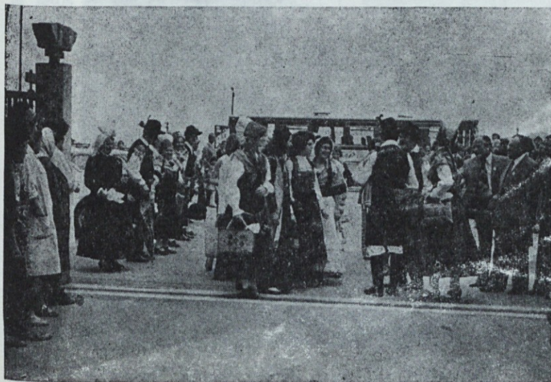
Sprejem nevest na glavnem vhodu v podjetje; 28. maj

Višek vaje je bil gotovo napad letal. Najprej je zakrožilo nad našimi zgradbami izvidniško letalo, kateremu so sledili bombniki. Improviziran požar so domači gasilci hitro lokalizirali in pogasili.