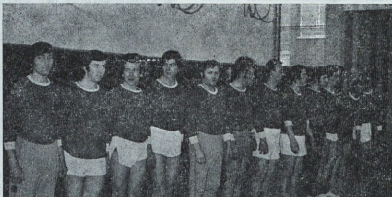
Odbojkarji Partizana Jarše pred tekmo z Lekovci