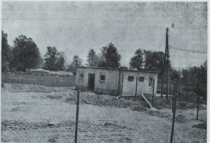
Garderobi na igrišču — spodaj vodočistilna naprava. Maj 75

Prepričani smo, da boste novost pozdravili in bolj kot pred tem hranili vaš zaslužek in porabili oziroma dvignili le toliko denarja, kolikor ga dejansko potrebujete v določenem času.