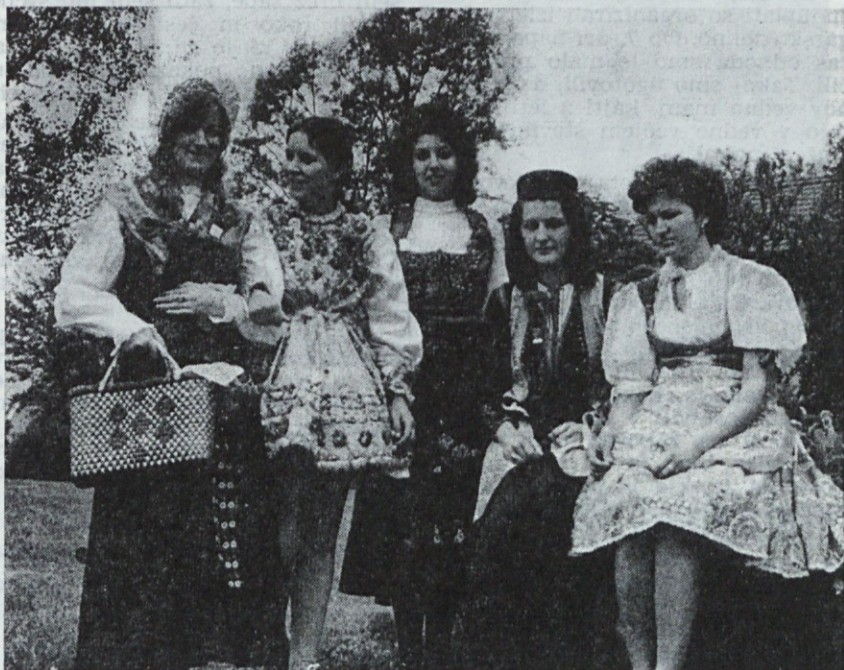
Kmečka ohcet — neveste iz Jugoslavije; maj 75