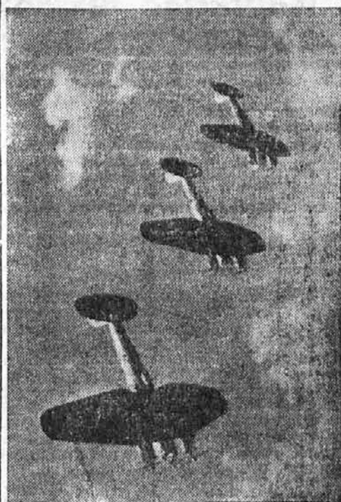
Skupina bojnih letal

Pri Zineti je bil samo betežni tast. Preplašeno se je priplazil k postelji ter gledal mlado ženo, kako se je mučila. Prosil je Boga, da bi se vse srečno končalo. Izgledalo pa je, da njegova molitev ne bo uslišana. Zineta je bilo vedno huje in huje. Od časa do časa je padla v nezavest, dokler ni končno izmučena zaspala. Niti najmanjšega znaka življenja ni