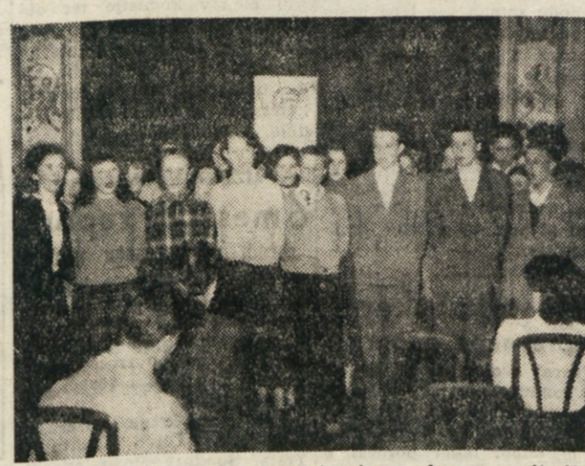
Dijaki iz Dijakškega doma nastopajo z zborno recitacijo

6. Iz Trsta je Viktor Parma (1858-1924), ki je postal popularen z glasbenimi točkami za Govekarjeve ljudske igre «Rokovnjaci» (1898) in «Legionari» (1903). Sploh je bilo njegovo delo posvečeno slovenskemu odru. Napisal je opero «Urh, grof celjska opere» (1894), Ksenija (1896), Stara pesem (1897), Zlatorog (1920) in Pavliha (1924) ter opere «Caricine amonke» (1902), Lukavi služnji (1906) Apolonov hram (1908) in Zaručnik v škripcih (1916). Razen tega je napisal še glasbene točke za Milčinskoga «Mogotni prst» glasbilni balado «Po vodni moža za zbor, sole in orkester, potem še godalni orkester in plesno glasbo. O grozno delo, če pomislimo, gromno delo, če pomislimo, da je bil v državni upravni službi (med prvo svetovno vojno kot okrajni glavar in vojniar) in vodil orkestre na podeželju! Po vojni je bil upokojen in postal častni kapelnik Narodnega gledališča v Mariboru. Njegova glasba je lahkotna, oblikovano drugačno in ima na mnogih mestih posrečene melodične misleke.