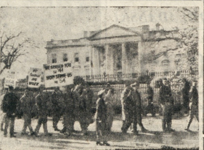
Clani Mednarodne zveze pristaniških delavcev demonstrirajo pred Belo hišo v Washingtonu v protest proti vladnemu nastopu proti stavki v newyorškem pristanišču. Pred Belo hišo je demonstriralo približno 1000 ljudi.

sovo morilske ekscurzije. To prepričanje zastopajo danes tudi vsi izraelski časopisi. Govori se, da se arabsko prebivalstvo, ki je v bližini meje, izseljujejo v notranjost države, da bi bilo čimbolj proč od meje z Izraelom.