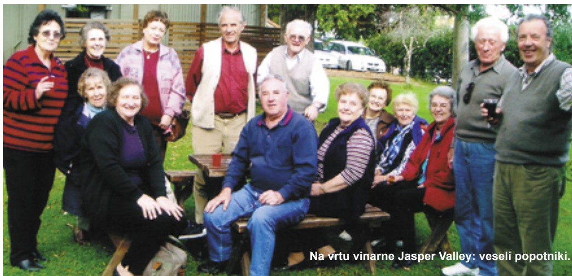
Na vrtu vinarne Jasper Valley: veseli popotniki.

krenili po vijugasti cesti, ki se je zvijala kakor kača navzdol proti morju v Kangaroo Valley. V prijetnem in slikovitem naselju, ki je zgodovinsko zaščiten, smo imeli kosilo v starinski gostilni ali Pub-u. Po kosilu smo nadaljevali pot navzdol proti morju, na poti pa smo uspeli najti tudi vinograd »Jasper Valley Vinery«, (Slovenci vedno najdemo kje kak vinograd!), kjer smo posedli po klopih na sončnem vrtu, pokušali domače vino in občudovali lepoto zelenih hribčkov in dolin, ki obdajajo vinograd. Pokrajina, posejana z rdečimi in pisanimi kravami, je vzbujala občutek, kot da smo v nedeljo po nauku doma v Sloveniji na sosedovem vrtu pod hruškami, v pogovoru s sosedi. Tako lepo, mirno in prijazno je bilo, da smo se kar težko odtrgali in se spet naložili na avtobus za pot mimo Wollongonga domov v Sydney.