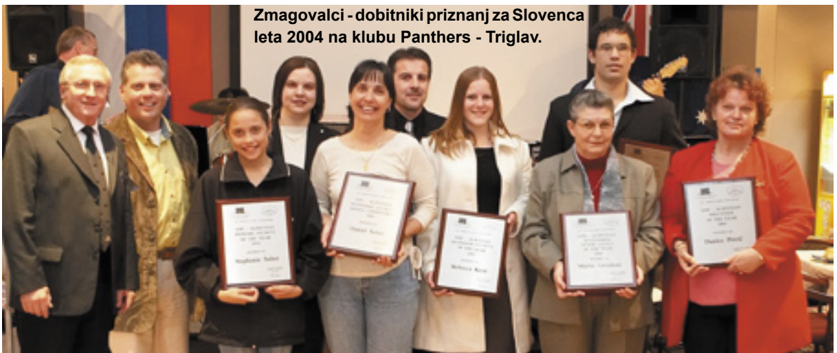
Zmagovalci - dobitniki priznanj za Slovence leta 2004 na klubu Panthers - Triglav.