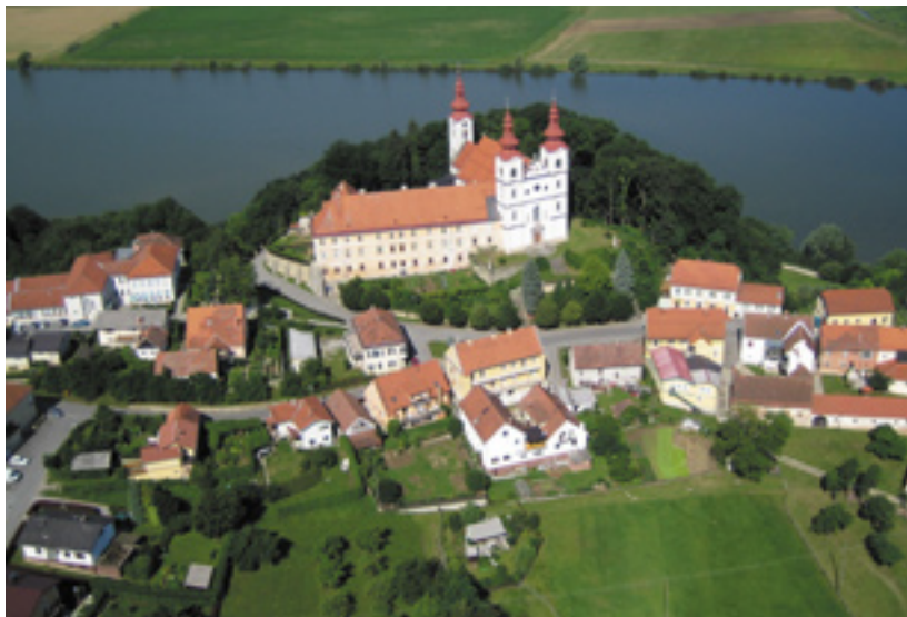
Prelepa Sveta Trojica v Slovenskih goricah.