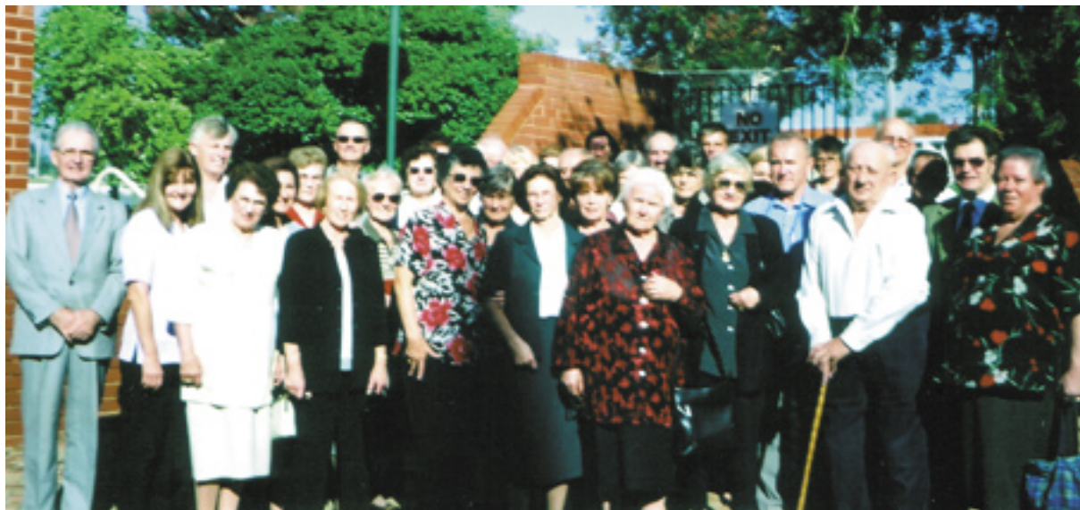
V letošnjem maju so se rojaki v Perthu dvakrat (dve nedelji) zbrali k slovenskemu bogoslužju.

Izredne dolžnosti v aprilu so zahtevale spremembe nekaterih načrtov. Odpovedati se je bilo treba sodelovanju pri Igralski družini v Merrylandsu in predstavitev vsakoletnega pastoralnega obiska z dvema nedeljama v Perthu na prvo in drugo nedeljo v maju. Sedmega aprila sem moral v bolnišnico na operacijo kile /hernije/ in tumorja (ni bil nevaren). Še v času okrevanja sem se zadnjega aprila odpeljal v Zahodno Avstralijo. Slovenci, zvesti Bogu in domovini, vidijo, kako jim pešajo moči in že razmišljajo, če bo še mogoče zbrati ljudi, da bi prišli k slovenskemu bogoslužju. Vse kaže, da se bodo morali patri vsako leto, dokler bo mogoče, posebej dogovoriti za obisk. Hkrati pa vedno prosijo, naj bi jih ne zapustili, četudi jih je malo, ker se v večernih urah življenja mnogi najraje in najlažje pogovorijo z duhovnikom in Bogom v materinem jeziku.