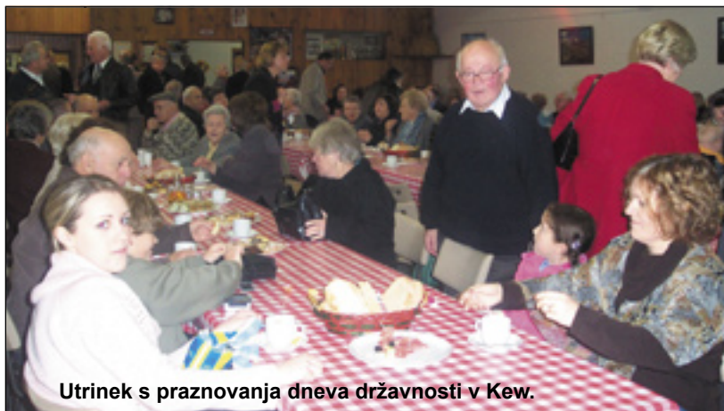
Utrinek s praznovanja dneva državnosti v Kew.

Sestra smrt je le malo prizanašala našemu ljudstvu. V zadnjih dneh maja je umrl 83-letni