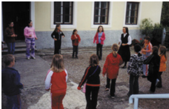
Sproščeni mladi s sestro na dvorišču.

V Ilirski Bistrici – Trnovem Šolske sestre de Notre Dame obnavljajo prostore, ki so jim bili letos dokončno v zelo slabem stanju vrnjeni. Ta del